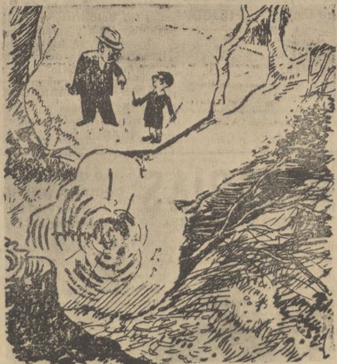
El padre.—Te regalo una navajilla y eso es lo que se te ocurre hacer!

En parecidos términos disertó, además, el ilustre hombre de ciencia, en el Instituto, sien do también ovacionado.