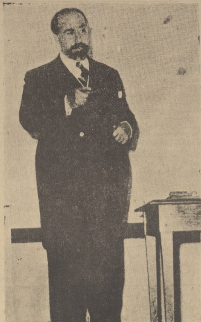
El exministro socialista don Fernando de los Ríos, durante la conferencia que ha pronunciado en el Centro de Estudios Hispánicos de París.—Versó sobre el tema «Madrid y su vida literaria»

de fué ovacionada sin reservas, recibiendo homenajes como el tributado por la Academia de Ciencias de Córdoba y la Universidad de Lisboa, que han con tribuido a popularizar su nombre. Deseamos que la musa más joven de la América española recoja en nuestra ciudad también muchos aplausos.