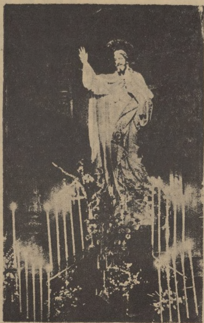
En Santurce se ha celebrado una solemne ceremonia con motivo de la restauración de la iglesia parroquial, que fué destruida por un incendio en enero de 1932. En la foto, la imagen del Sagrado Corazón, única que se salvó en aquel siniestro.