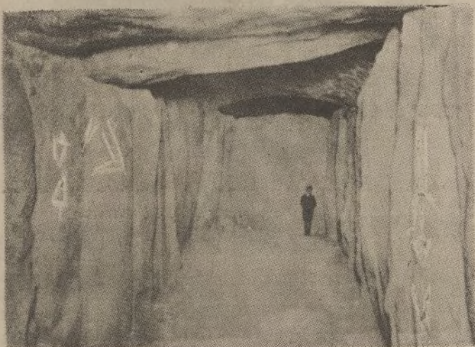
Vista de la cámara con los grabados reforzados de blanco.

El grabado de la losa 21 del lado izquierdo es sumamente interesante. Representa un