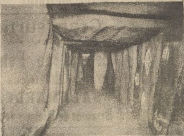
Vista del corredor, con los grabados reforzados de blanco.

Solicite catálogos de las obras que hay en esta casa. Se le remitirá a quien lo solicite en la Papelería DIARIO DE HUELVA