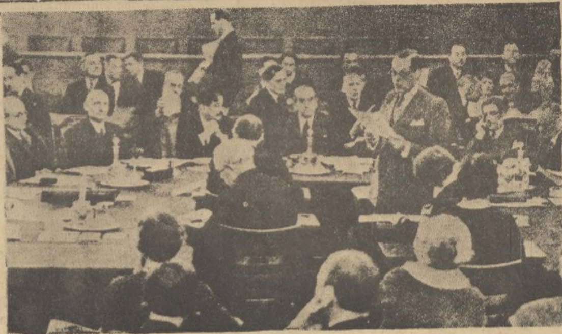
Un momento de la sesión de reapertura de la Conferencia de Ginebra. De izquierda a derecha se ve a los señores Madariaga (España), Laval (Francia), Bruce (Australia), Eden (Inglaterra) y Litvinoff (Rusia)

GRAN FUNCION INFANTIL a base del magnífico caballista Tom Kenne, RIO ESCARLATA y notables dibujos. Sorteo de Juguetes