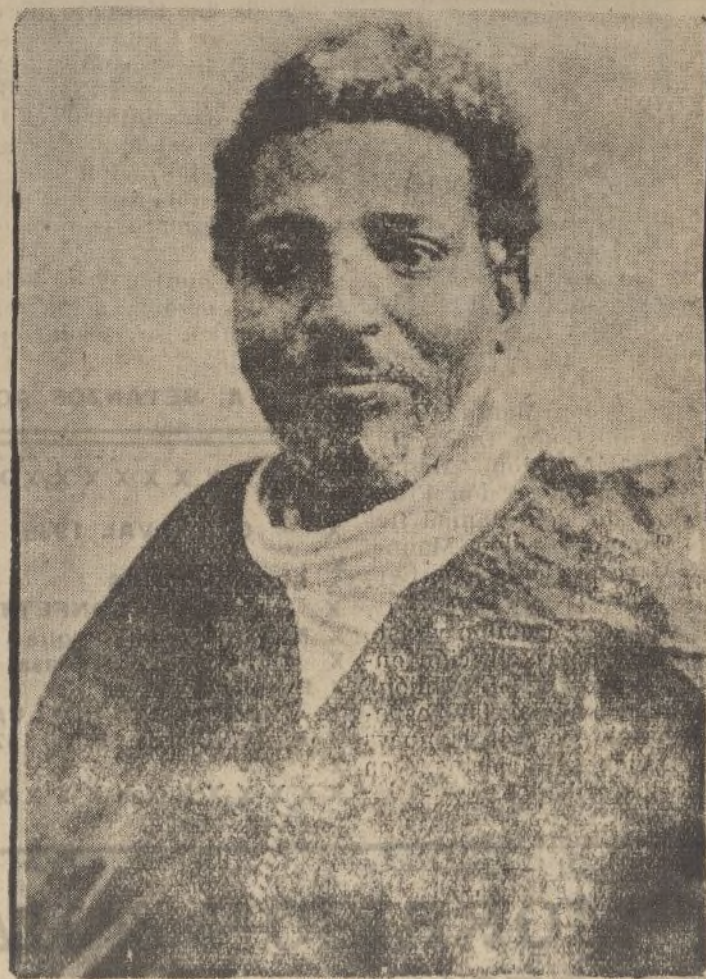
El ras Mulugheta, ministro de la Guerra, que ha marchado con sus tropas al frente guerrero para reforzar los contingentes ibínicos allí concentrados