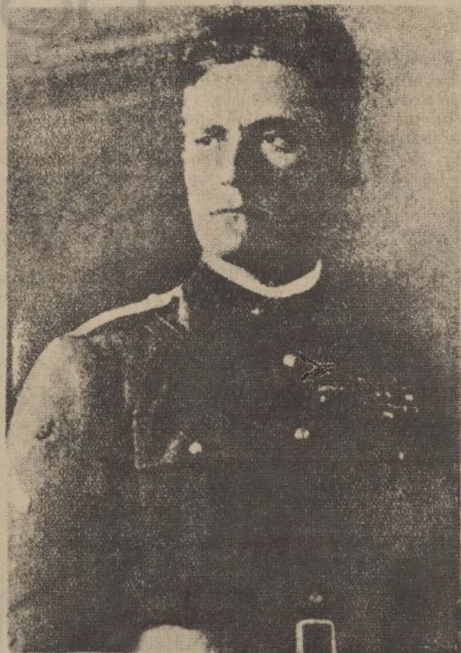
El general Graziani, jefe de las tropas italianas del frente Sur de Etiopía, a quien se indica para el mando supremo de las fuerzas en campaña, en sustitución del mariscal Badoglio

C. de Gibraltor, 148 Teléfonos 1439 - 1992