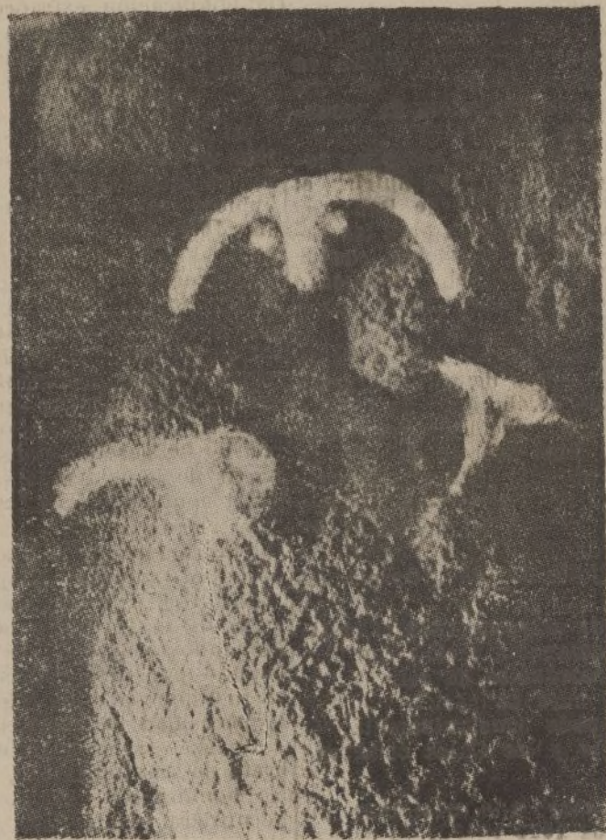
Grabado del ídolo dolménico

fuerles, como las momias de América del Sur.