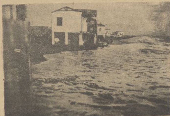
Las aguas del Oceano a media marea cubrían por completo la playa, llegando a las construcciones más próximas, según puede advertirse en estas dos fotos

El más completo surtido en libros para contabilidad en clase y precios, lo encontrará en la Papelería del DIARIO DE HUELVA