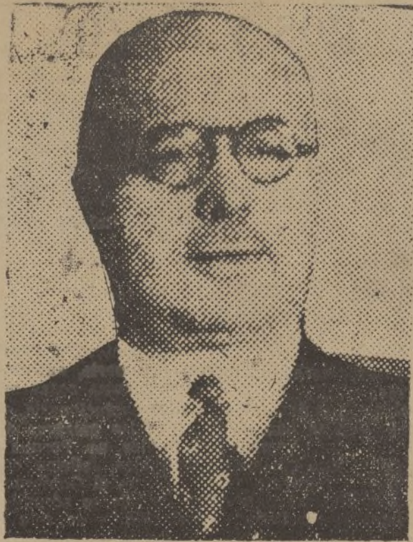
Don Joaquín Urzáiz Cadaval, ministro de Estado y candidato a diputado a Cortes por la provincia de Huelva