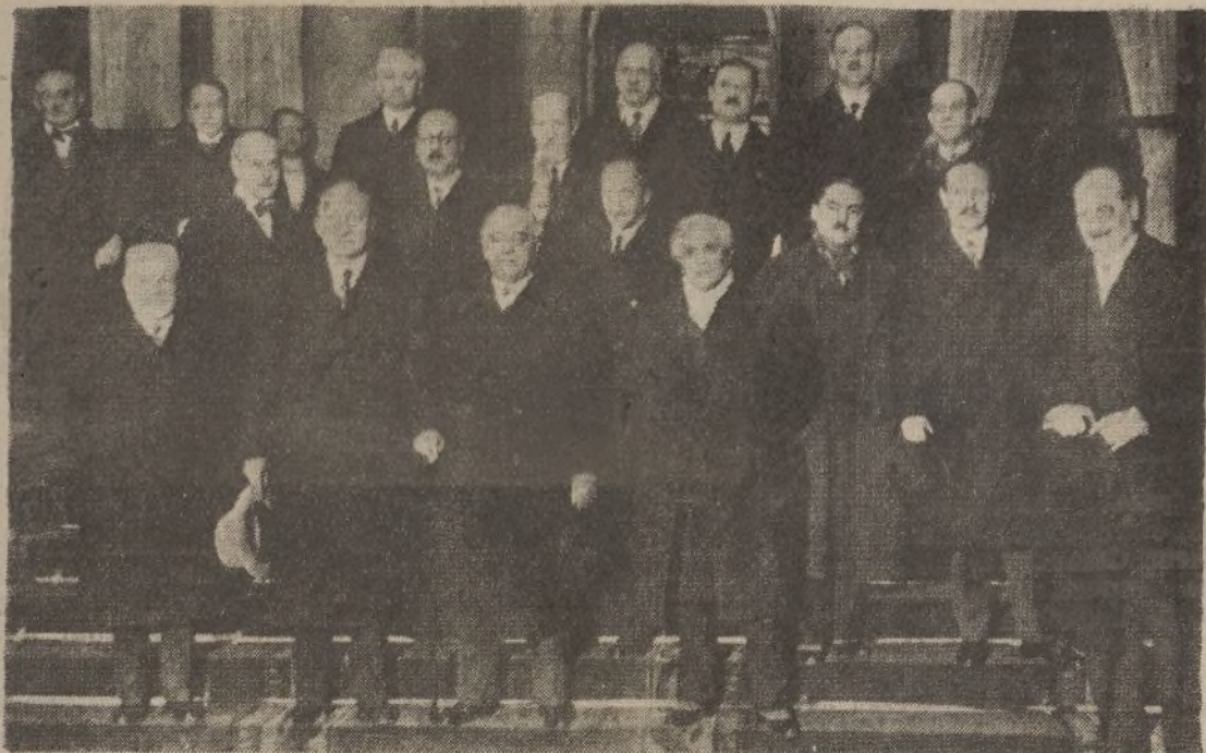
De izquierda a derecha, los nuevos ministros franceses, señores Regnier, Mandel, Pietri, Delbos, Frossard, Sarraut (presidente), Guernot, Bonnet, general Morin, Paul Boncour, Chautemps y Flandin