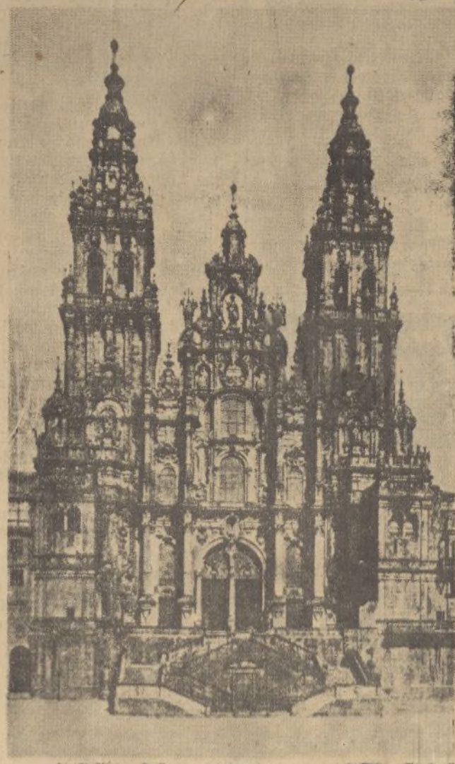
Santiago de Compostela.-La Catedral