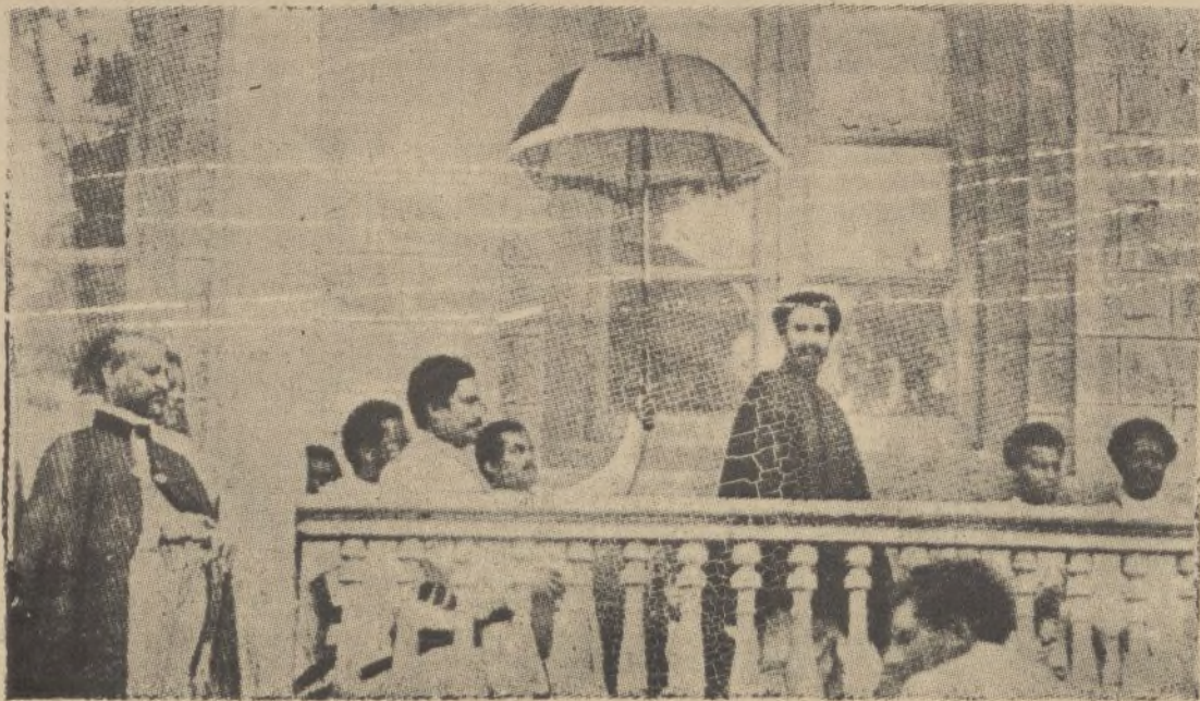
ABDIS ABEBA.—El Negus Negusti, Hailé Selasié, contempla desde una galería de su palacio la marcha de sus guerreros hacia el frente.

Sagasta, 3 y 5 - HUELVA - Teléfono, 1512