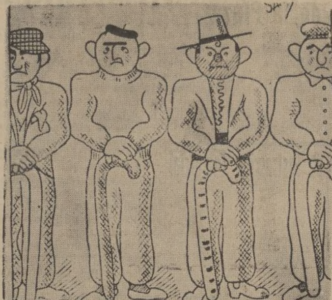
La próxima Gestora, no sabemos si municipal o provincial.