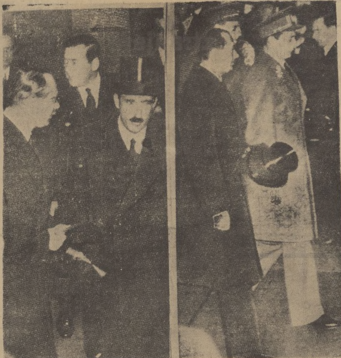
El rey Boris de Bulgaria llega a la estación Victoria para asistir a los funerales del rey Jorge V, y es recibido por el duque de Gloucester.