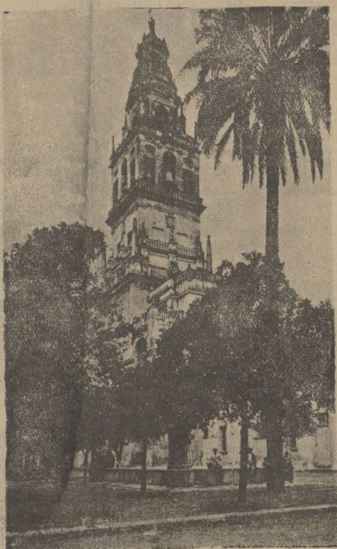
Córdoba.—Torre de la Catedral

de don Antonio Maura, para recordar a los remisos electores que el voto no era solo un derecho, sino también, y por encima, un deber ineludible. Ha sido necesario el revulsivo de los últimos tiempos para que se produzca la reacción actual. ¿Quién pensará que la gente había de preocuparse de comprobar su inclusión en las listas electorales, cada cual decidido a concurrir a las urnas como quien va a defender un reduci