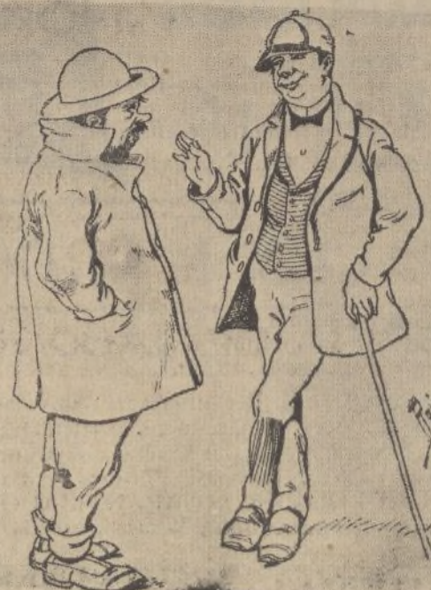
—¿Este año sentará usted la cabeza? ¿Arreglará usted su vida? —Sí; el año pasado pagaba a unos y no pagaba a otros... este año no pago a nadie.

En la Papelería del DIARIO DE HUELVA encontraréis el surtido más completo de material para dibujo, a precios no conocidos; plumas estilográficas, funcionamiento garantizado, desde 1.50 ptas.; cajas de pinturas, desde 0.50, cajas de lápices de colores, etc..