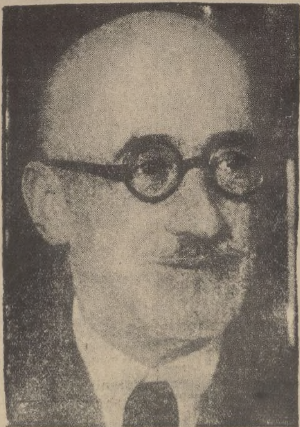
El glorioso escritor don Jacinto Benavente, al que el Ayuntamiento de la capital de la República ha concedido la medalla de Oro de la Villa de Madrid