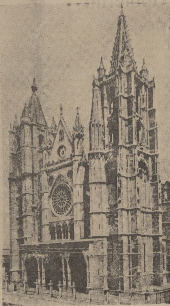
La Catedral de León