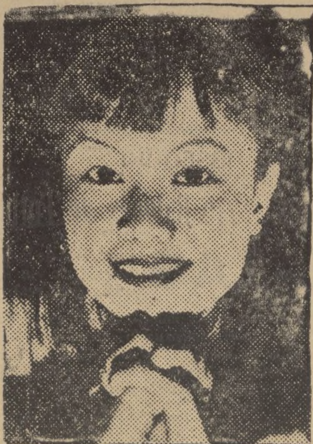
La hija del emperador siamés en los Estados Unidos que va a debutar en Hollywood, con el nombre de Mai-Mai