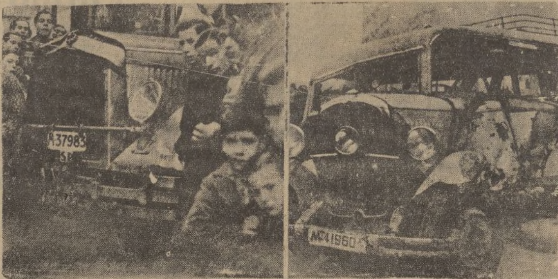
En Madrid, un camión de viajeros de Madrid-Toledo chocó contra el que ocupaban numerosos alumnos del Colegio Alemán, ocasionando heridos a varios de estos.— Estado en que quedaron ambos vehículos

De todas clases y tamaños Papejería DIARIO DE HUELVA