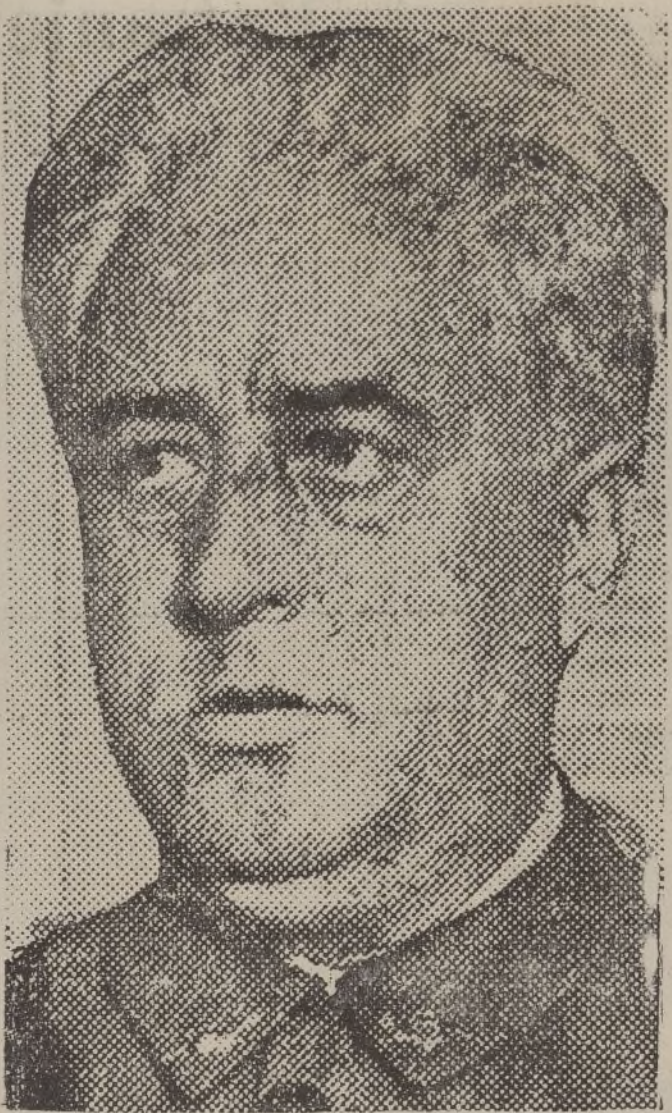
El teniente coronel don Juan Yagüe, que se ha hecho cargo del mando de la segunda bandera de la Legión