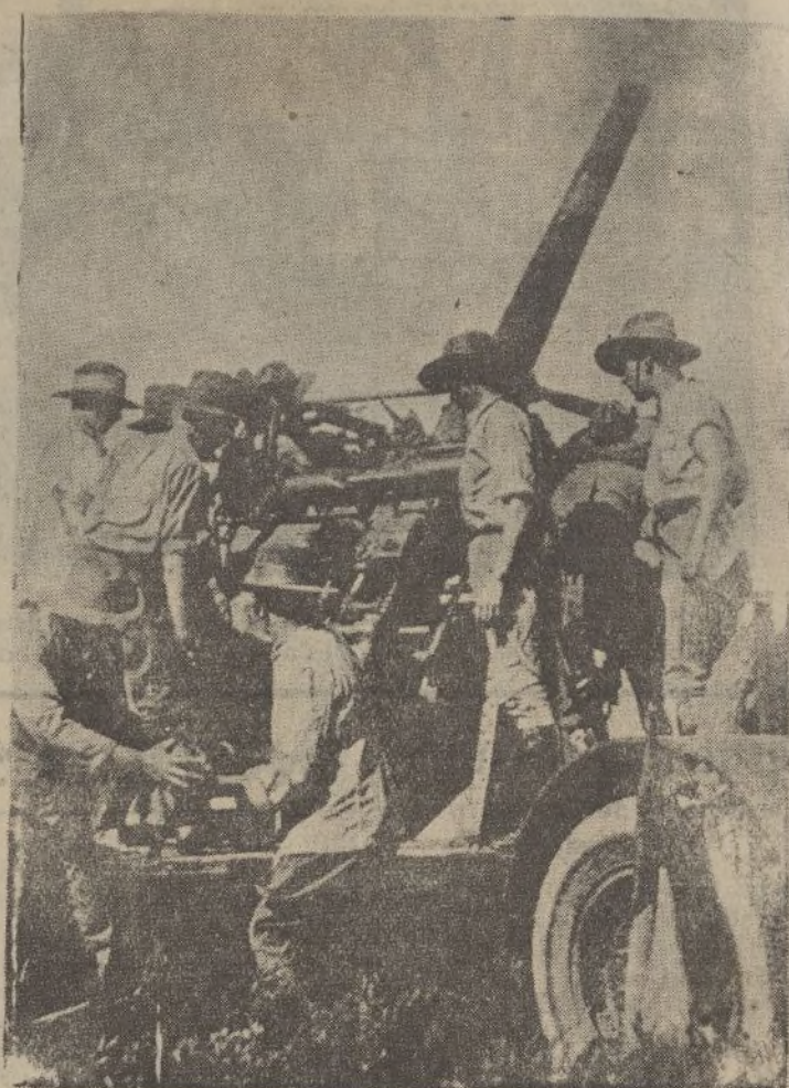
Moderna batería antiaérea motorizada que ha sido adquirida para el ejército australiano, haciendo disparos en las pruebas oficiales.

X X X X X X X X X X X X X X X X X X CARNAVAL 1936 X X X SERPENTINAS X X CONFETTIS X X Más económico que en X X ninguna otra Casa X X Papelería del X X X DIARIO DE HUELVA X X X X X X X X X X X X X X X X X X