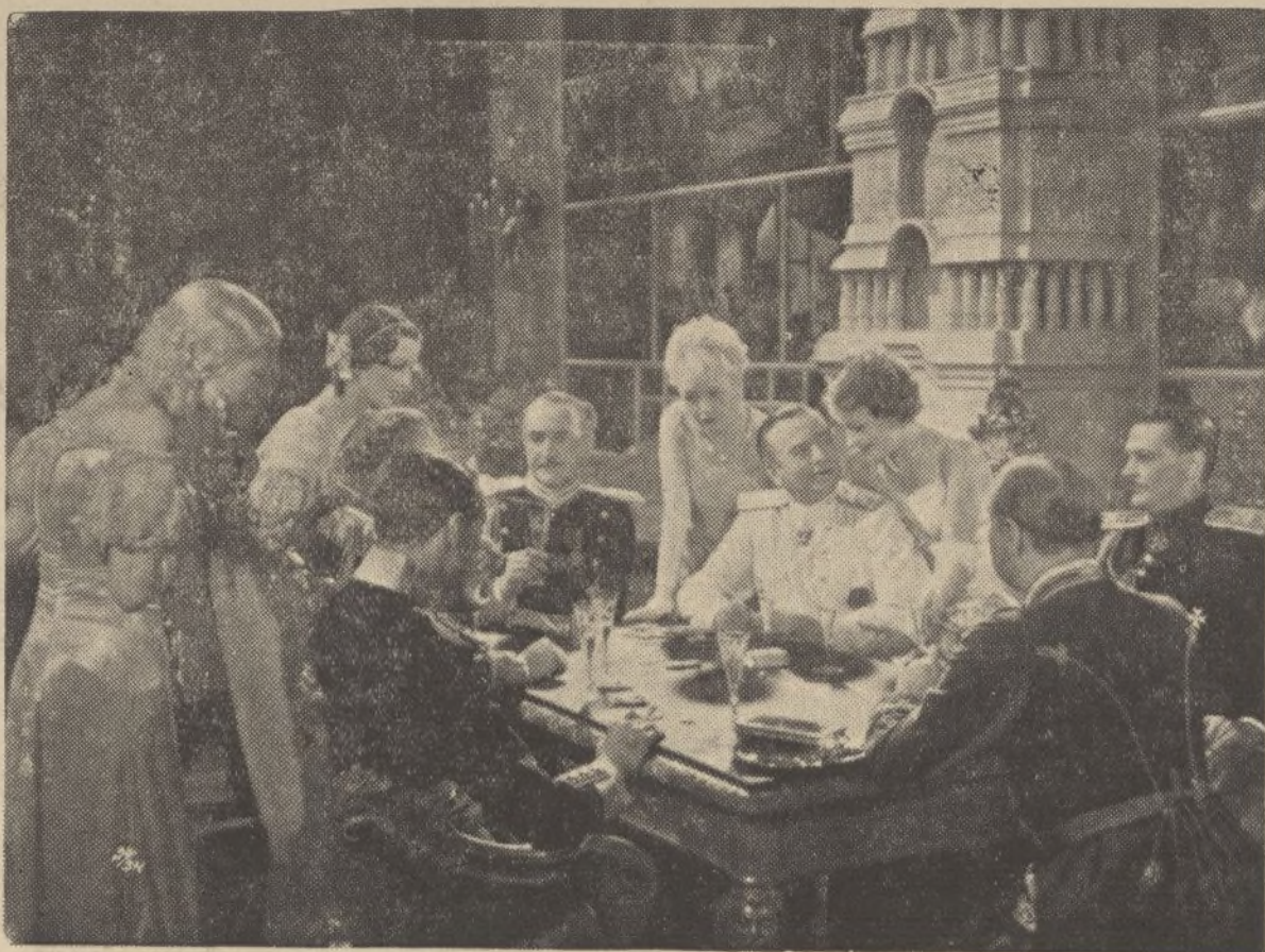
Una escena de la opereta alemana de Cifesa, «FIESTA EN PALACIO», que protagonizan los famosos artistas Camilla Horn e Ivan Petrovich