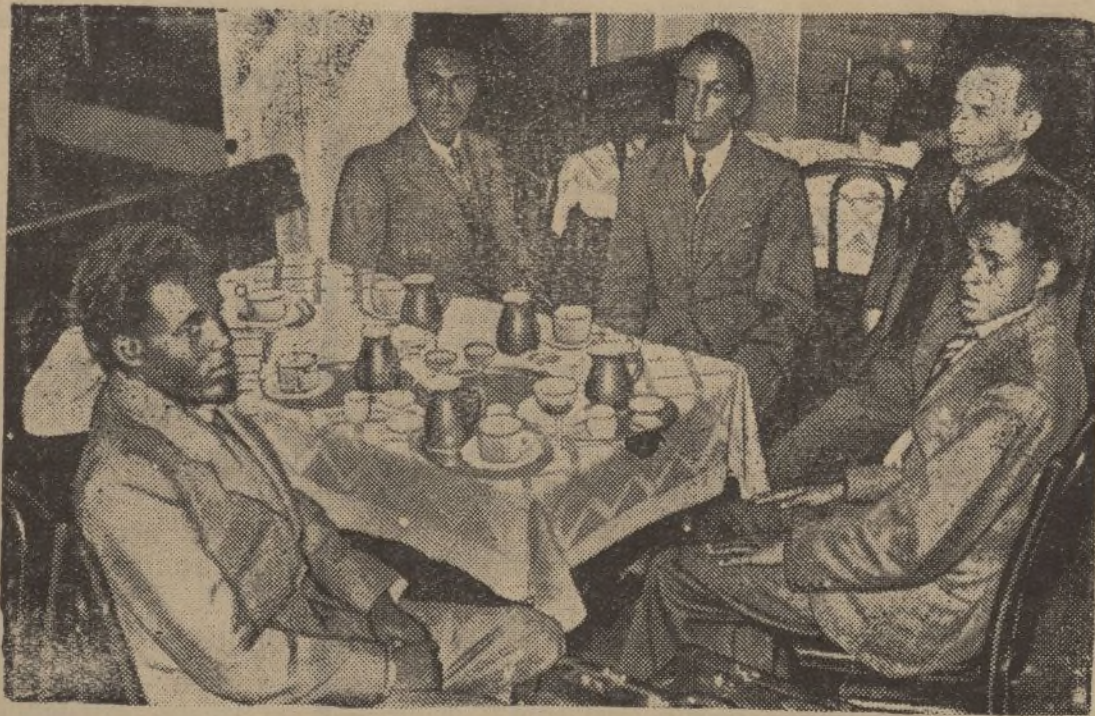
Estos cuatro jóvenes, fotografiados aquí con un periodista, son cuatro abisinios que han llegado a Europa para seguir sus estudios. Los gastos de éstos son pagados por el Negus y primeramente estudiarán varios sectores técnicos en Alemania.