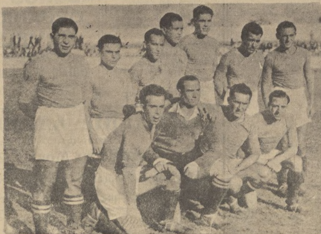
El equipo del Xerez F. C. que después de una actuación brillantísima ha logrado clasificarse en su grupo

TACOS DE ALMANAQUE De todas clases y tamaños Papelería DIARIO DE HUELVA