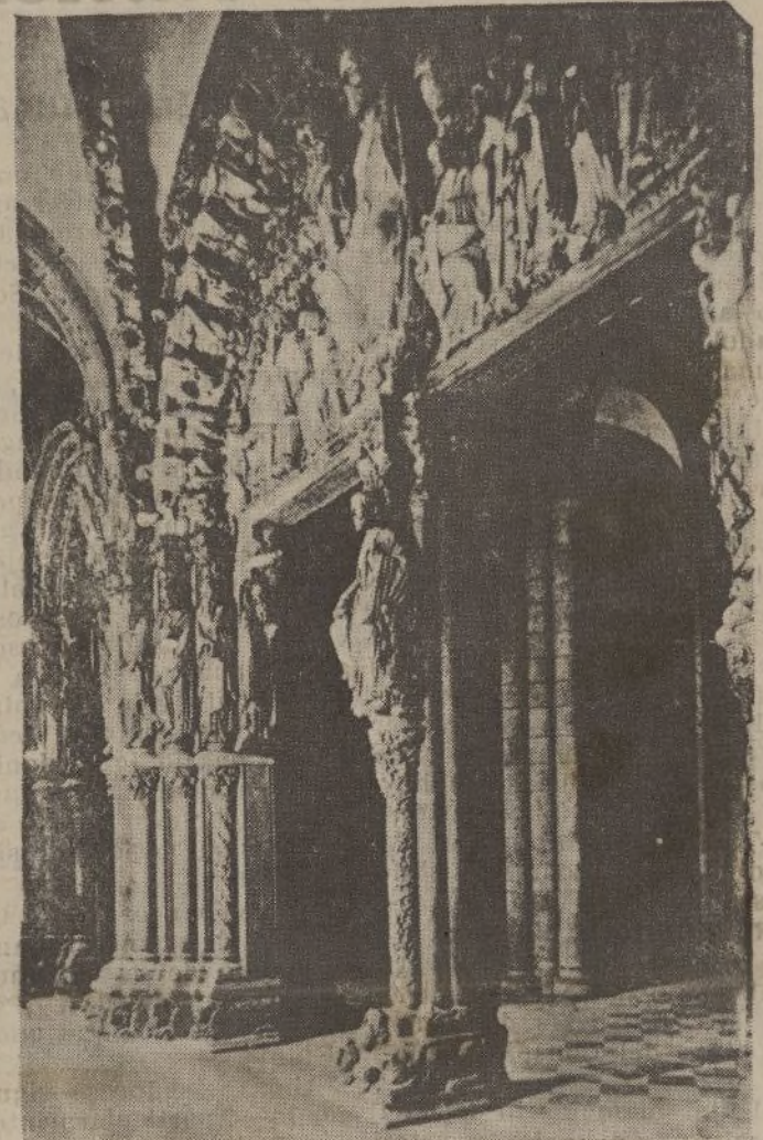
Santiago de Compostela.—Pórtico de la Gloria