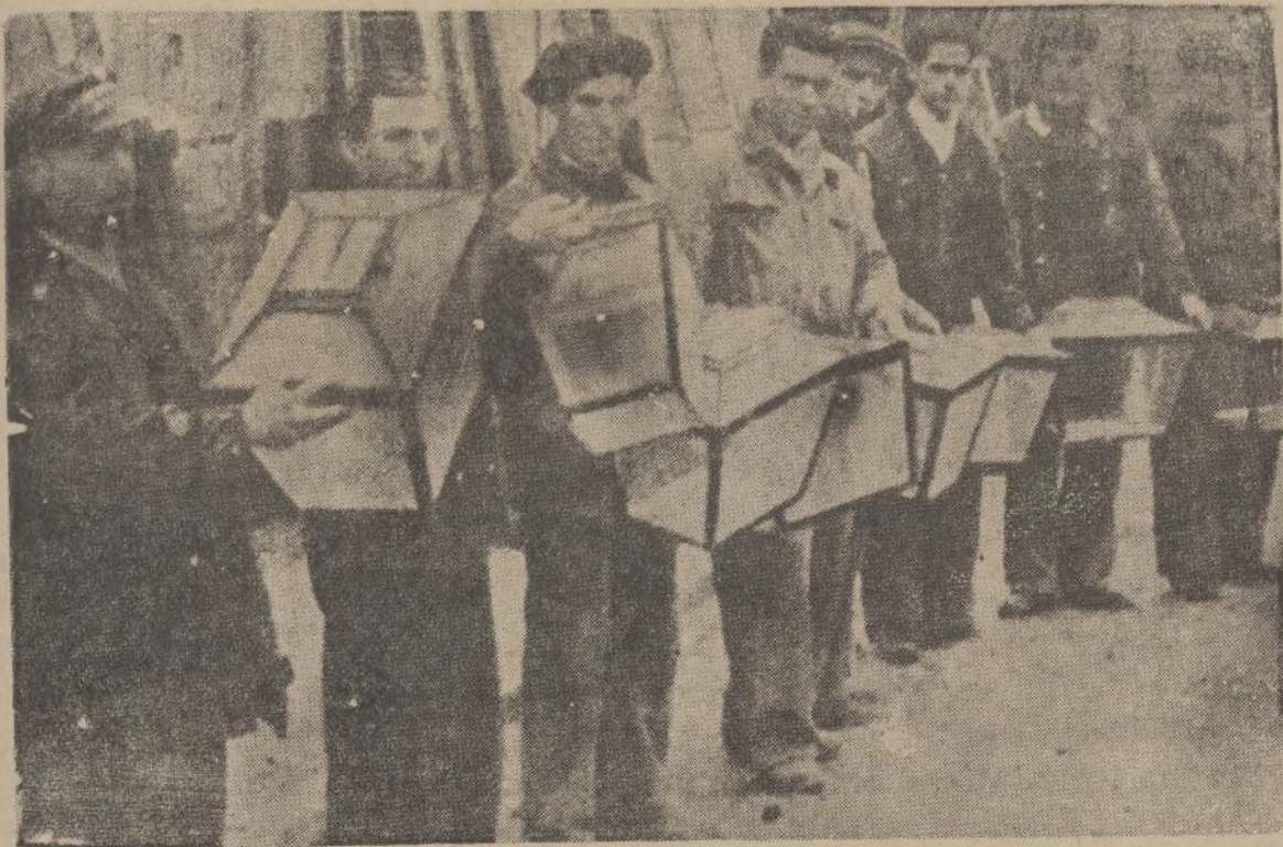
Las urnas están preparadas. El próximo domingo recogerán los sufragios de los ciudadanos, que han de decidir sobre el porvenir de España y, acaso, sobre su nueva estructuración. Estemos atentos, con la fe puesta en Dios y la confianza en los buenos españoles.