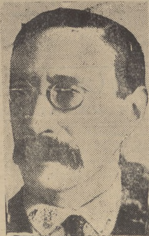
León Blum, jefe de los socialistas franceses, contra el que se ha perpetrado un atentado por parte de un grupo de jóvenes monárquicos.—El líder socialista ha resultado gravemente herido

Fantástico surtido en libros escolares, de Pedagogía, de Matemáticas, etc. Gran surtido en material para la escuela. Solicite catálogos de las obras que hay en esta casa. Se le remitirá a quien lo solicite en la