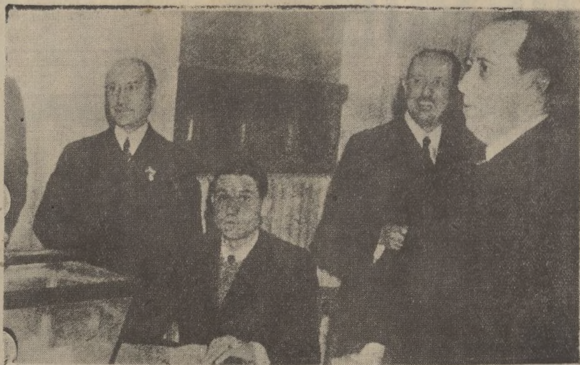
El jefe de Acción Popular, don José María Gil Robles, en el momento de votar.