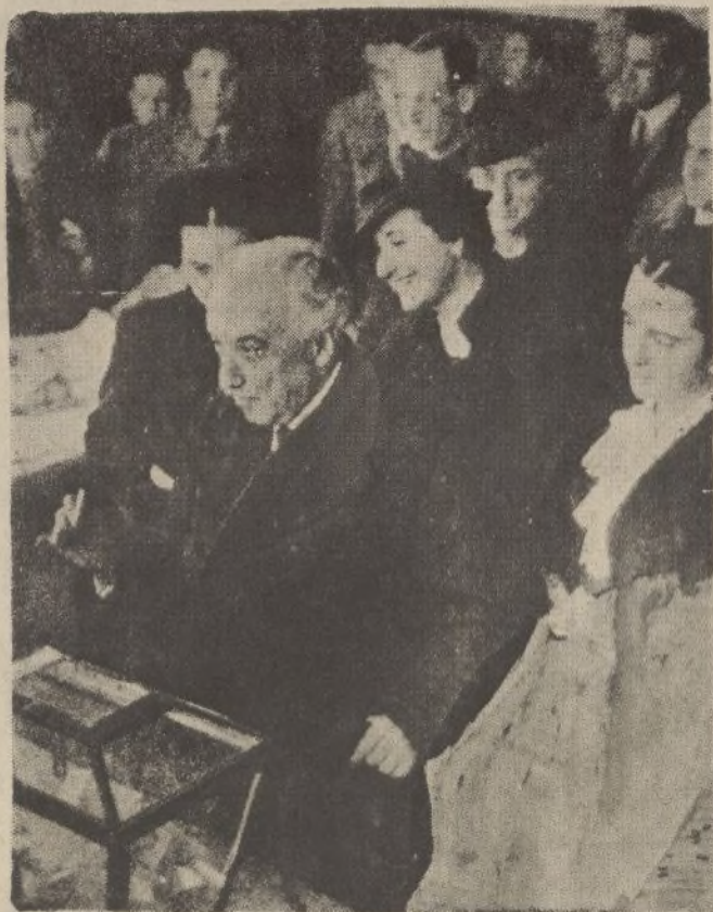
Su excelencia el Presidente de la República, entregando su papeleta de votación, a primera hora del domingo

Suntuosa presentación en español, en el CINEMA RABIDA