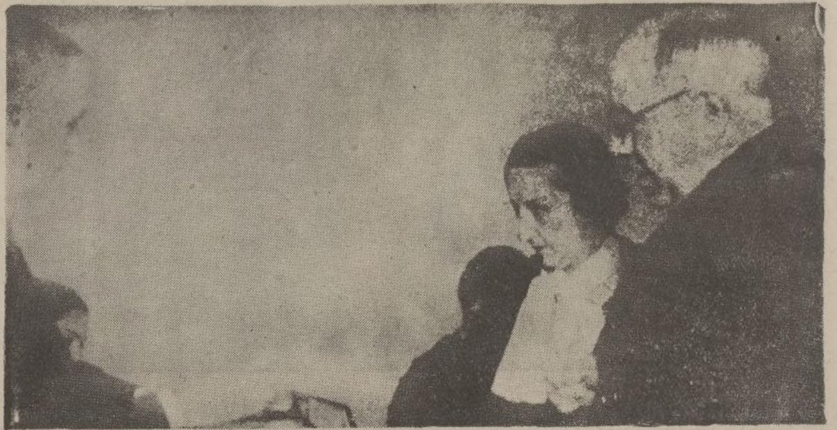
El ex presidente del Consejo don Manuel Azaña, acompañado de su esposa, en el momento en que ambos emitieron su voto.

Lo lamentamos con toda el alma. No nos asustan las izquierdas en un régimen parlamentario, frenadas y controladas por fuerzas opuestas. Comprendemos que en un sistema democrático y parlamentario tiene que existir un partido de izquierdas, pero no era éste para España, el momento de las izquierdas ni éstas se han presentado al Cuerpo electoral limpias de cadenas y mediaciones.