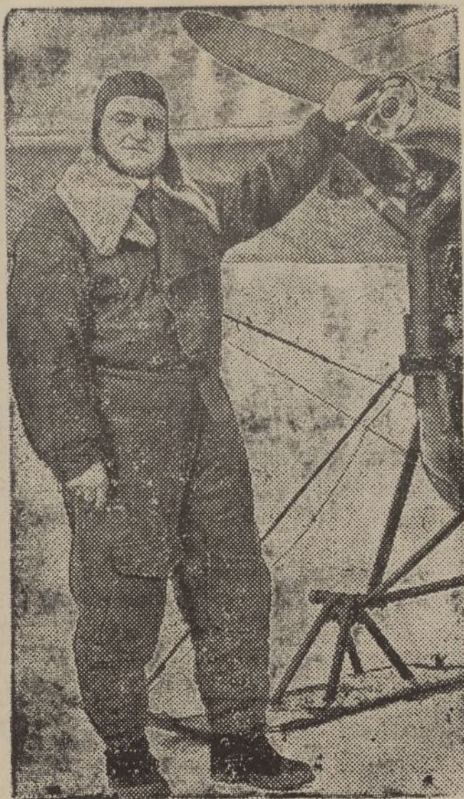
Un sacerdote que ha volado más de 50.000 millas inglesas por las regiones heladas del Canadá, a fin de predicar y distribuir alimentos entre los indios pobres de los grandes bosques