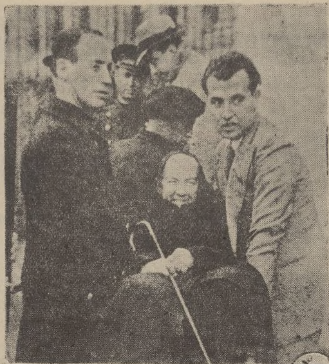
La animación electoral en Madrid se tradujo en la presencia de numerosos impedidos, a quienes sus familiares transportan a los colegios para emitir el voto. He aquí a una anciana electoral.

A todo comprador, por cada DIEZ PESETAS que empleen regalan una ficha para el próximo sorteo de LOTERIA, con tres premios en metálico, el primero de 300 pesetas, segundo 200 y tercero 100.