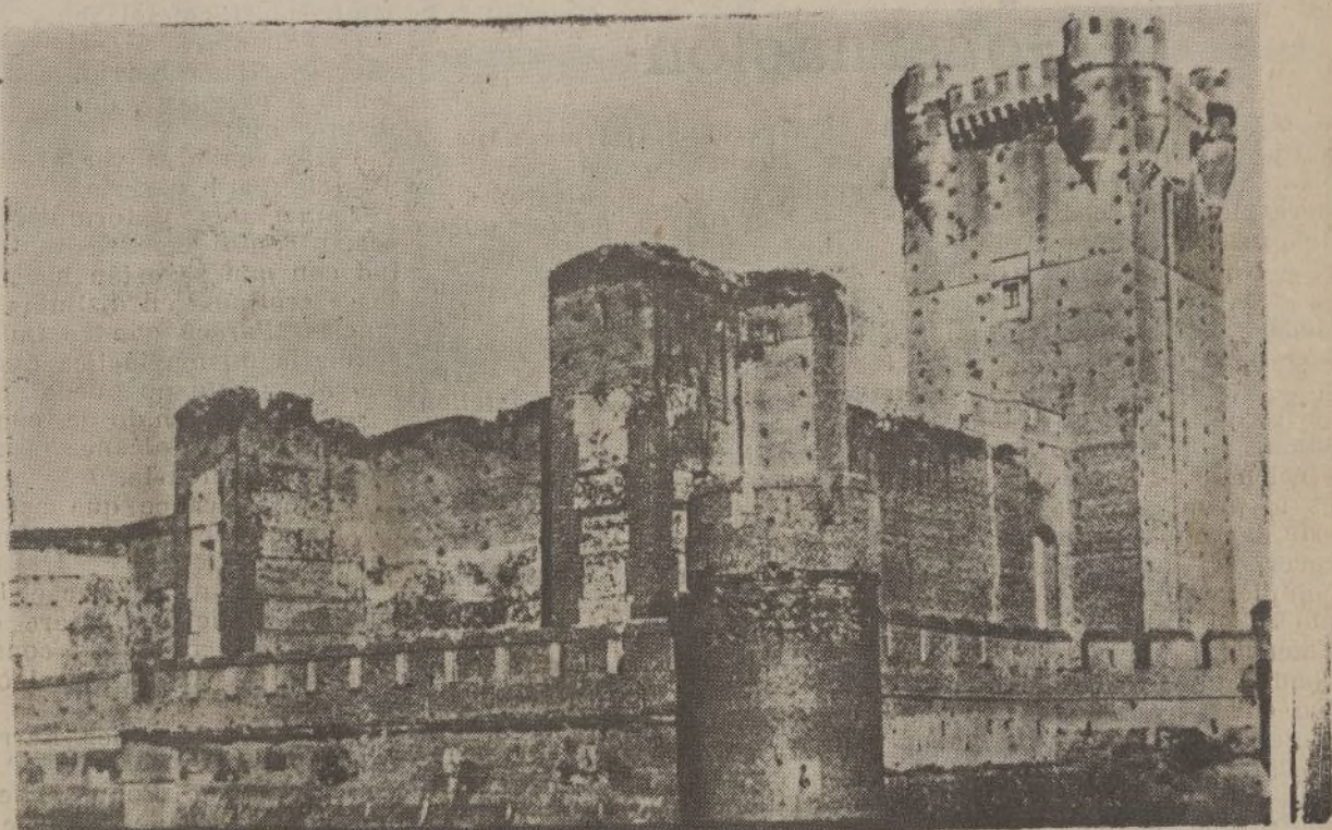
Medina del Campo. (Valladolid)