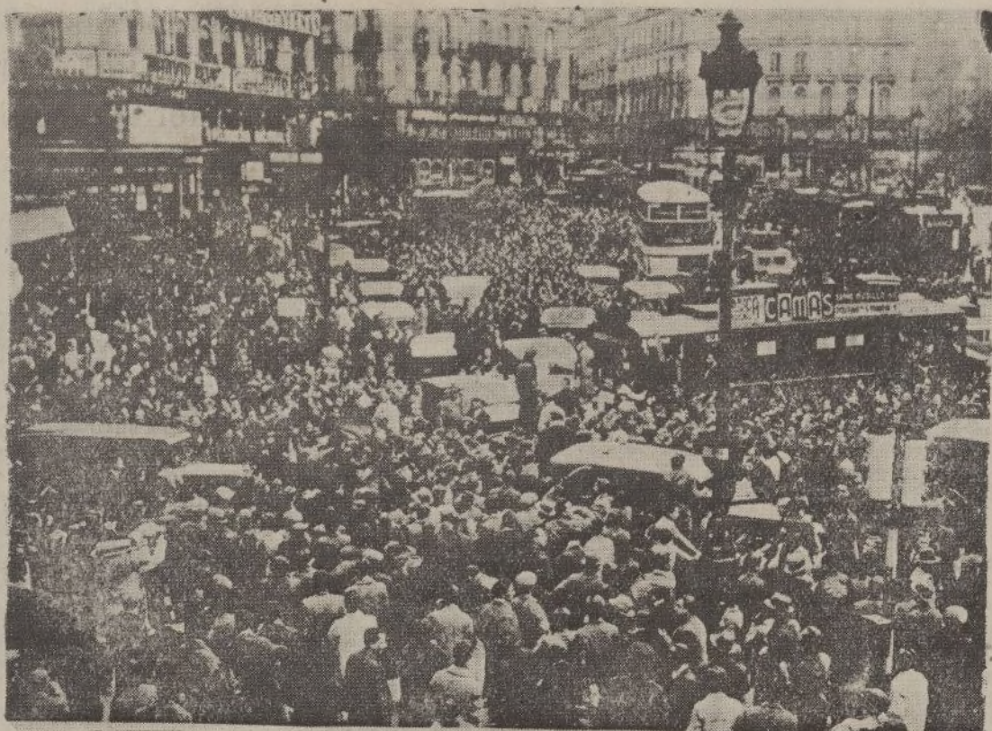
Una manifestación en la Puerta del Sol, de Madrid, celebra con júbilo el triunfo del Frente Popular