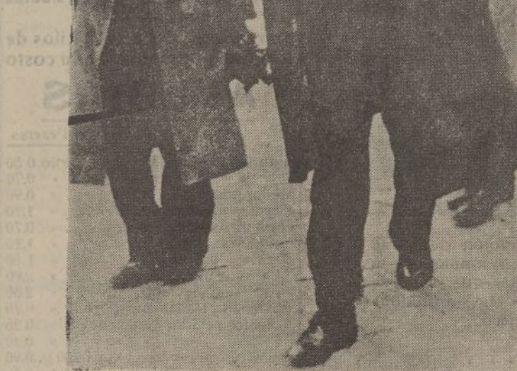
El exministro don Francisco Largo Caballero, satisfecho del triunfo de las izquierdas

Instrucción Pública. —Proyecto de ley sobre crédito ex-