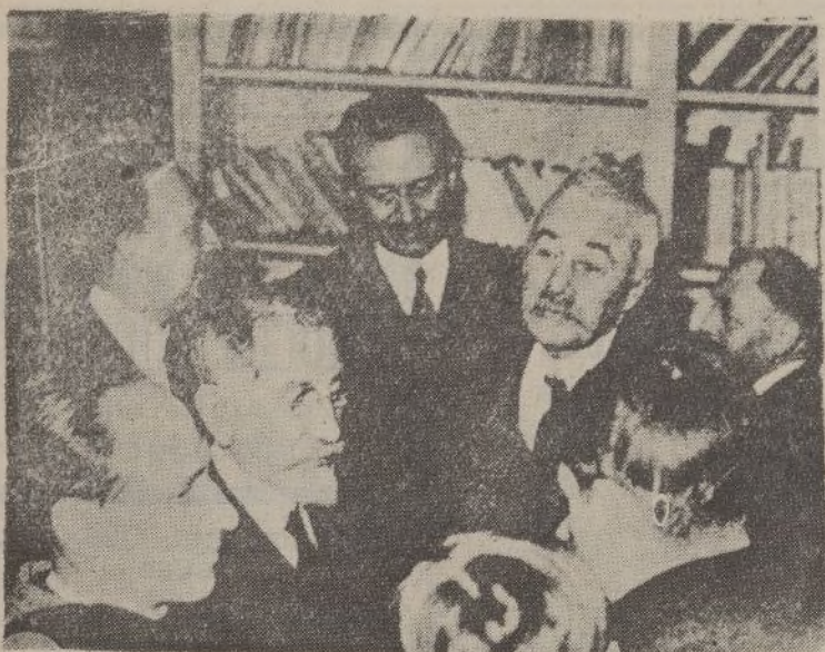
La agresión al líder socialista León Blum ha dado lugar, como es sabido, a la disolución de Acción Francesa, de los Camelots du Roi y de la Federación Nacional de Estudiantes de Acción Francesa. En la foto, M. Maurrás, haciendo declaraciones a los periodistas acerca de estas noticias