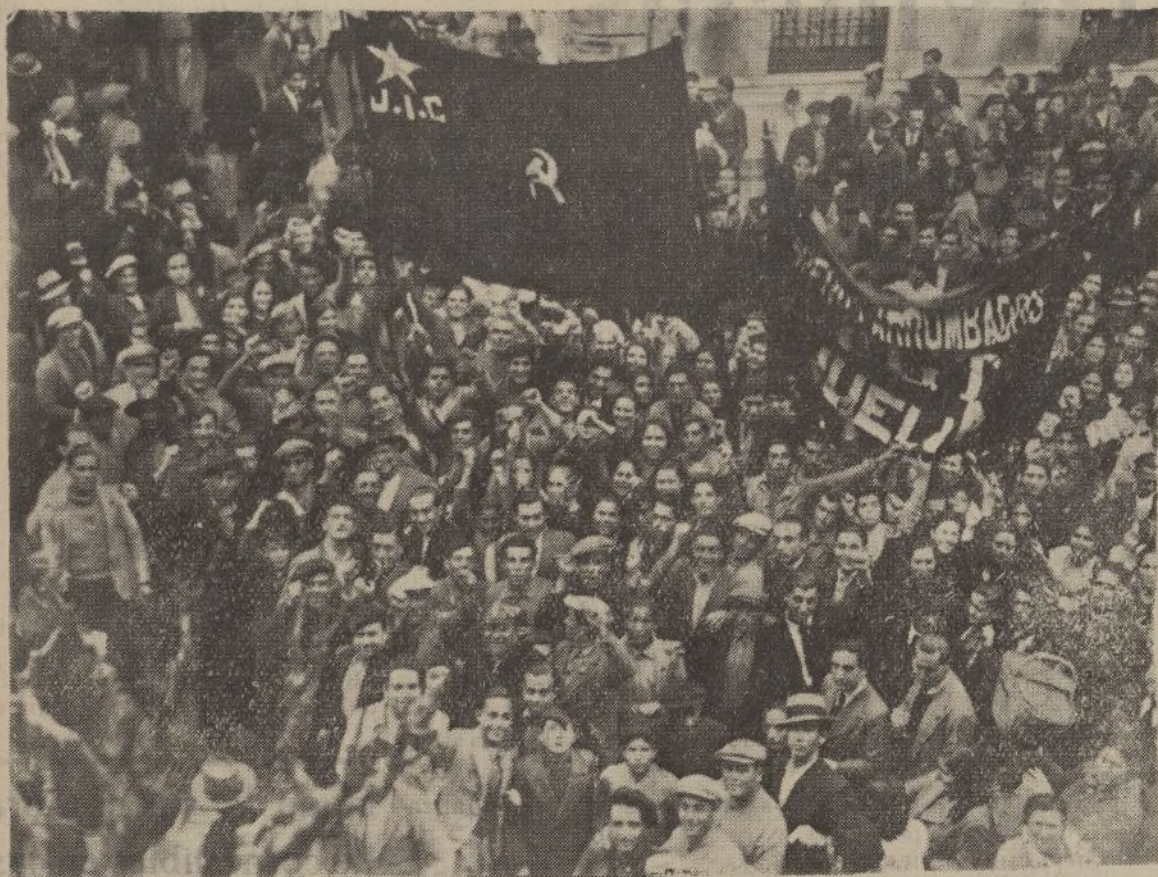
La manifestación al pasar frente al Ayuntamiento