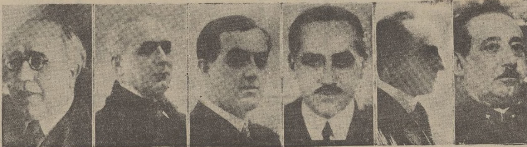
D. Manuel Azaña Presidencia