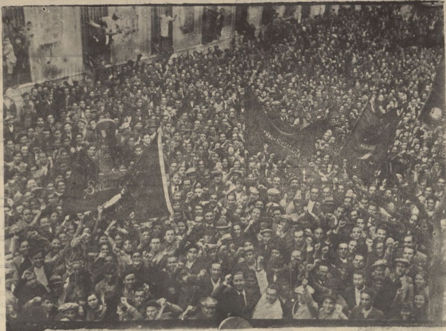
Otro momento de la manifestación celebrada por el Frente Popular