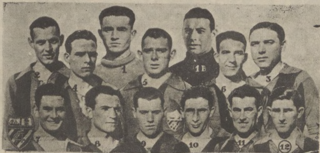
El equipo del Arenas de Guecho que mañana domingo se enfrentará con el Xerez F. C. en el partido de la Segunda División de Liga