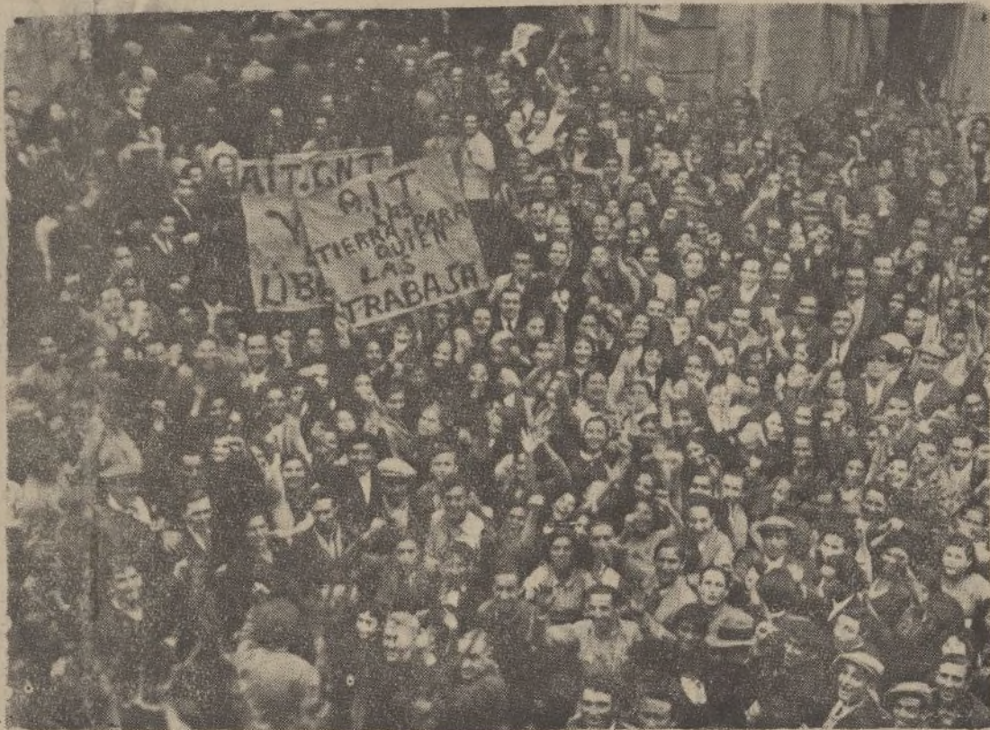
Un aspecto de la manifestación izquierdista del Jueves.