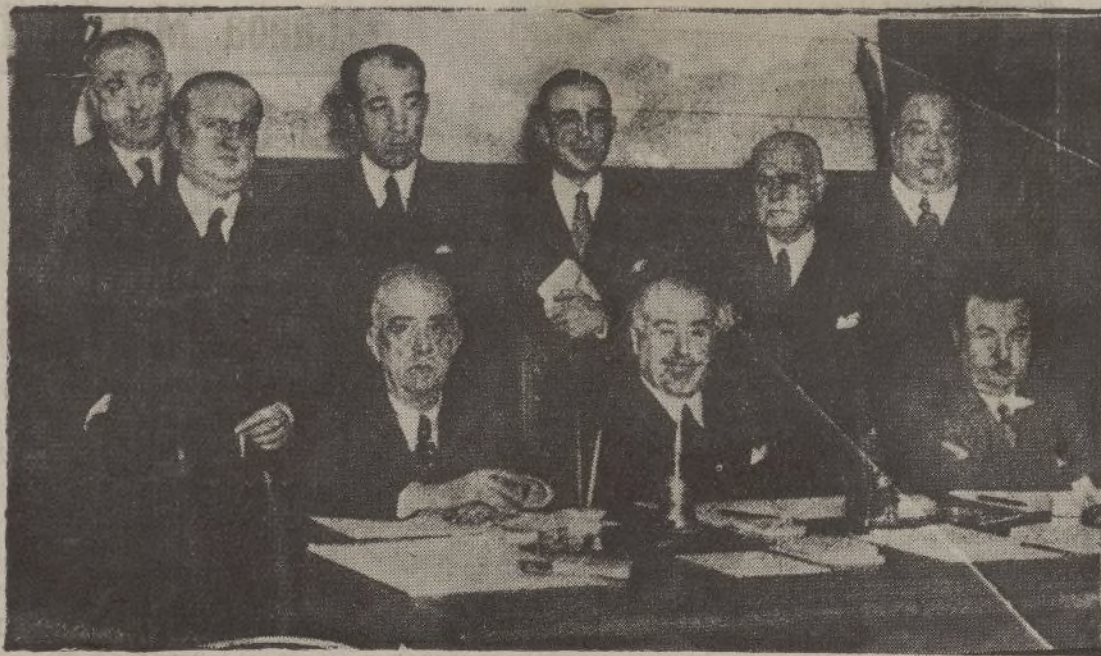
Los miembros de la Diputación Permanente de las Cortes, durante la reunión que fue aprobada la amnistía

En la Papelería del DIARIO DE HUELVA encontraréis el surtido más completo de material para dibujo, a precios no conocidos; plumas estilográficas, funcionamiento garantizado, desde 1.50 ptas.; cajas de pinturas, desde 0.50, cajas de lápices de colores, etc., XXXXXXXXXXXXXXXXXXXX