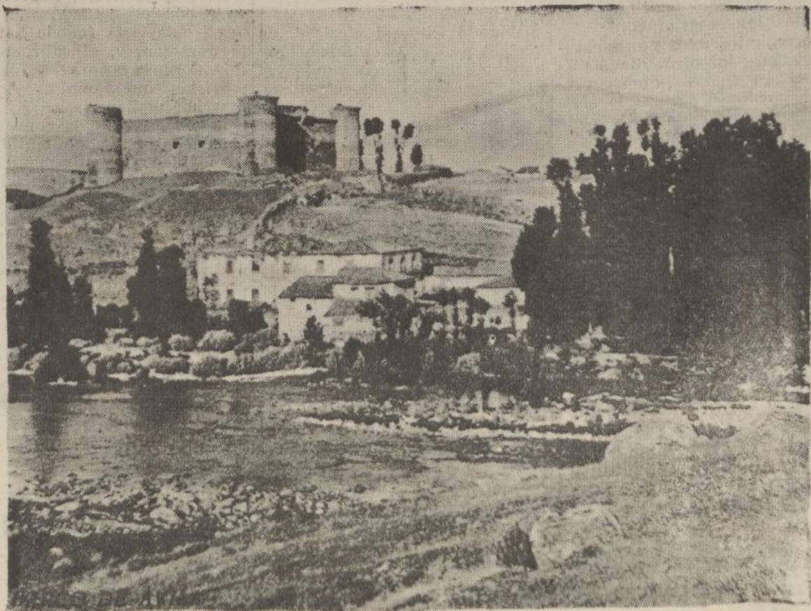
Barco de Avila