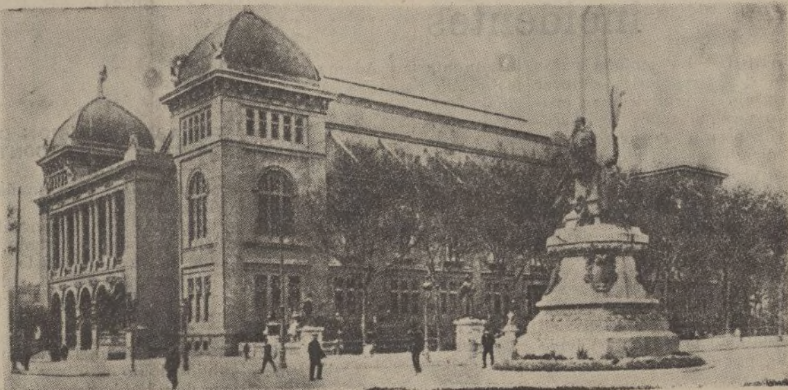
Palacio de Bellas Artes.