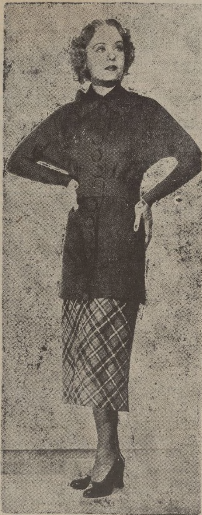
La bellísima «estrella» Madge Evans, luciendo una primorosa blusa de lana azul, con botones forrados y falda a cuadros blancos y negros.