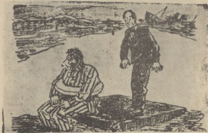
EL CONDE NAUFRAGO.—Hoy no estoy para nadie, John. Me encuentro cansado.