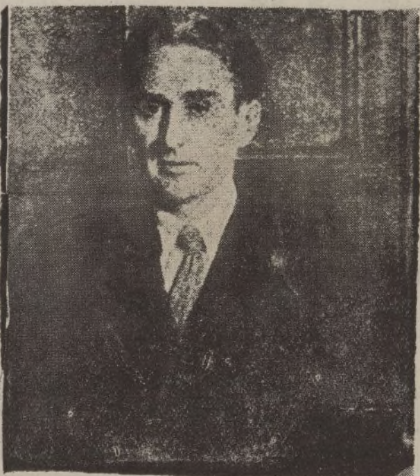
Don Braulio Solsona, exgovernador civil de Huelva y prestigioso periodista, al que el Gobierno de la República ha conferido el mando de Valencia. Esta designación ha sido muy bien acogida en la capital levantina.