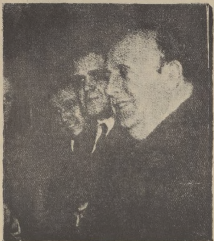
Don Indalecio Prieto, momentos antes de pronunciar su discurso en el mitin socialista del Cine Europa