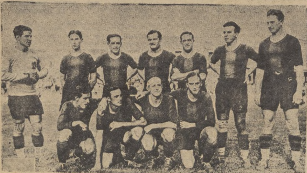
Equipo del «F. C. Barcelona» que en el partido jugado el domingo perdió ante el «Sevilla» por dos «goals» a uno.