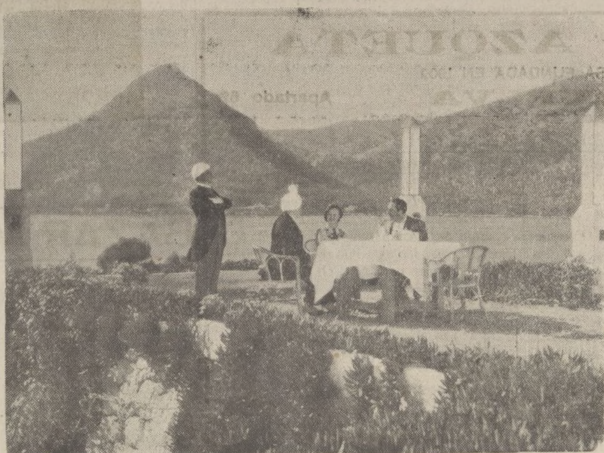
Un plano de «Rataplán», la película dirigida por Paco Elías para la editora valenciana Cifesa.