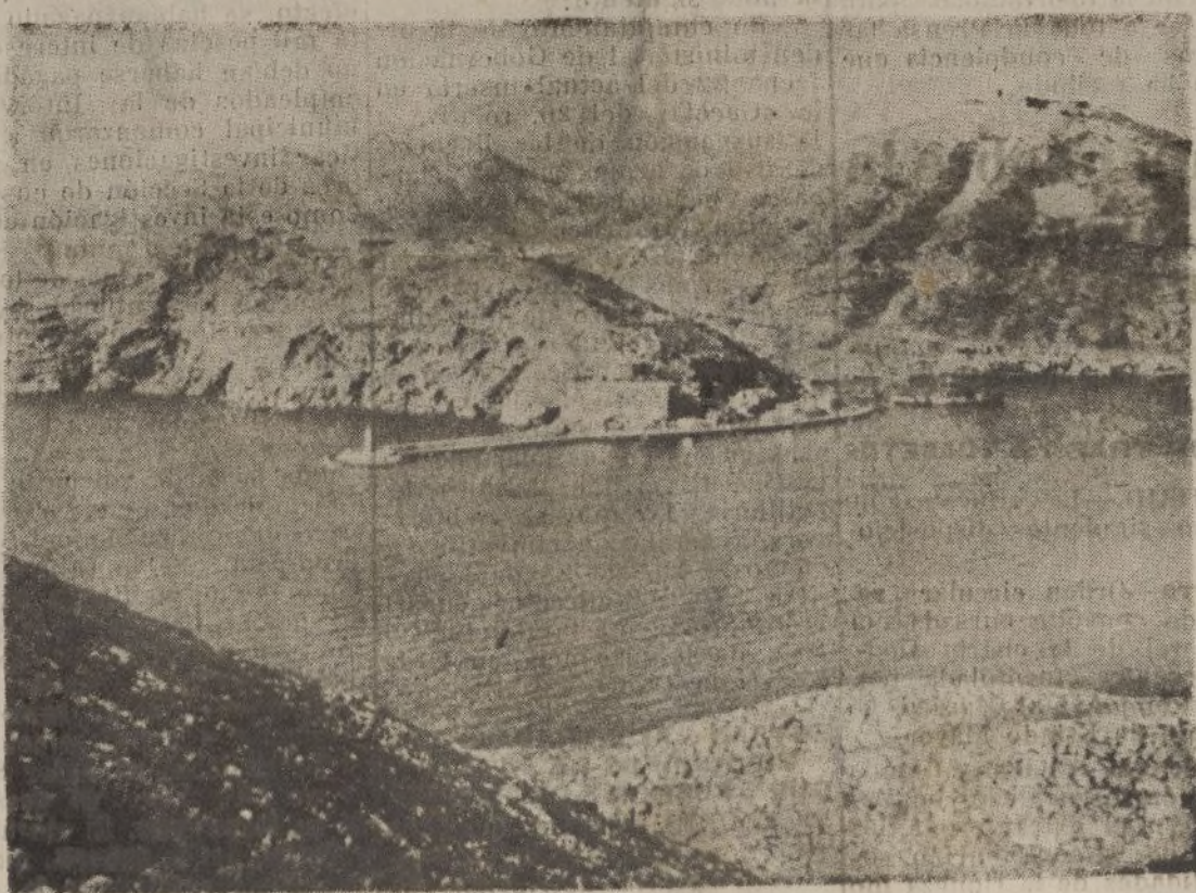
Cartagena.—Entrada al puerto