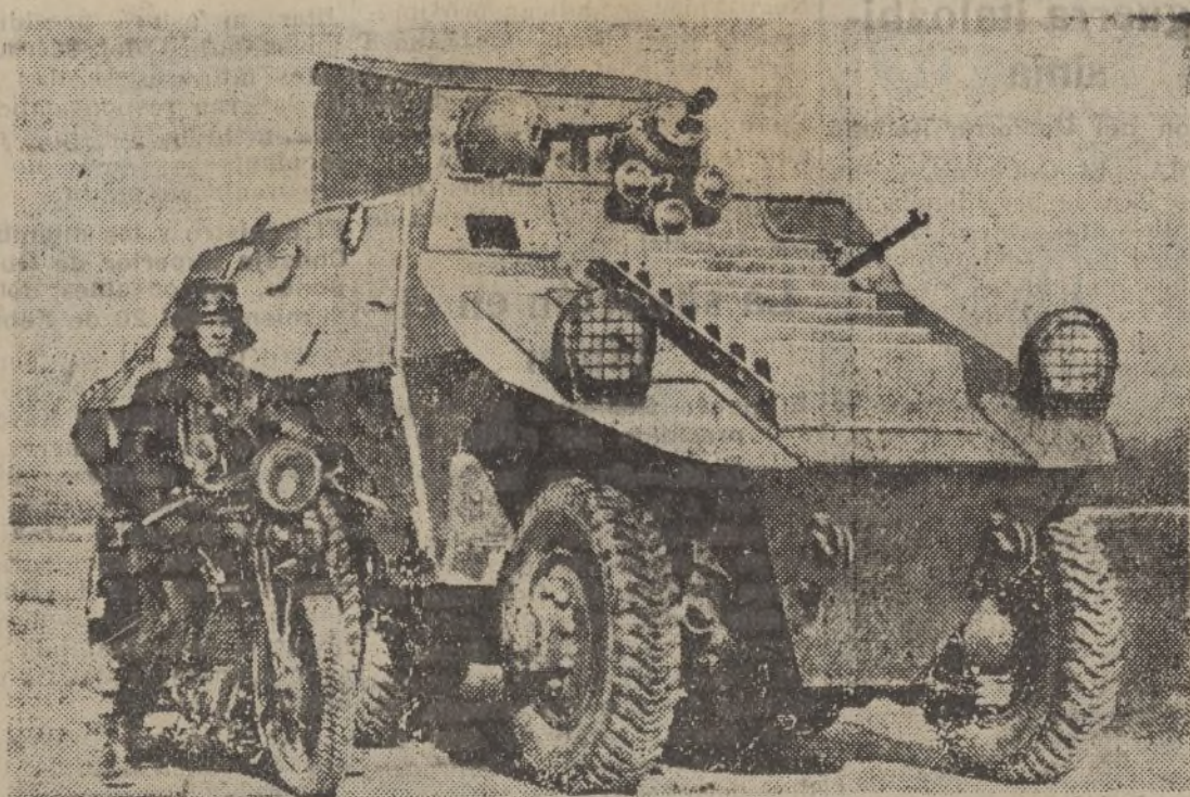
En los alrededores de Viena, el ejército austriaco ha celebrado sus maniobras de invierno. Por primera vez tanques y carros blindados han sido utilizados.