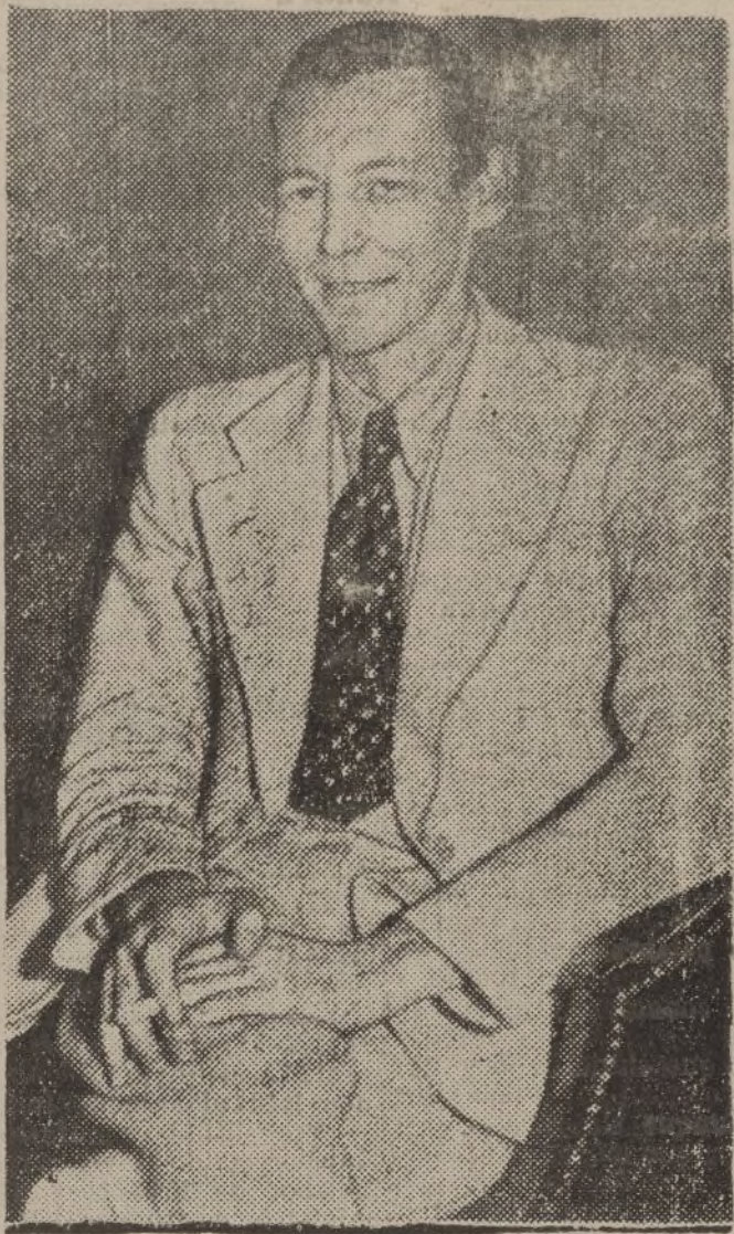
En la foto se ve al corresponsal americano, Willian Chaplin, que en compañía de muchos de sus compañeros ha abandonado Etiopía a causa de que les perjudica el clima. Ha dicho que la guerra italo-etíope durará por lo menos cinco años.