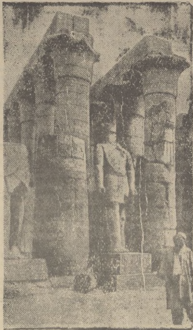
En Luxor donde no hace mucho tiempo fueron encontrados objetos antiguos de gran valor, han sido hallados recientemente dos tumbas y otros interesantísimos objetos de arte

Leyes especiales y la Constitución misma regulan los derechos y los deberes de los funcionarios. Flados en esa garantía legal, muchos ciudadanos han hecho intensos estudios para entrar al servicio del Estado o de los Ayuntamientos. ¿Es mucho pedir al Gobierno y a los Ayuntamientos que se atengan a lo estatuido y legislado? ¿Es, acaso, excesivo el recordar que para las destituciones, para las suspensiones, hasta para ciertos traslados, están previstos los trámites, y que no se puede prescindir ni salir de ellos, sin entrar en lo arbitrario?»