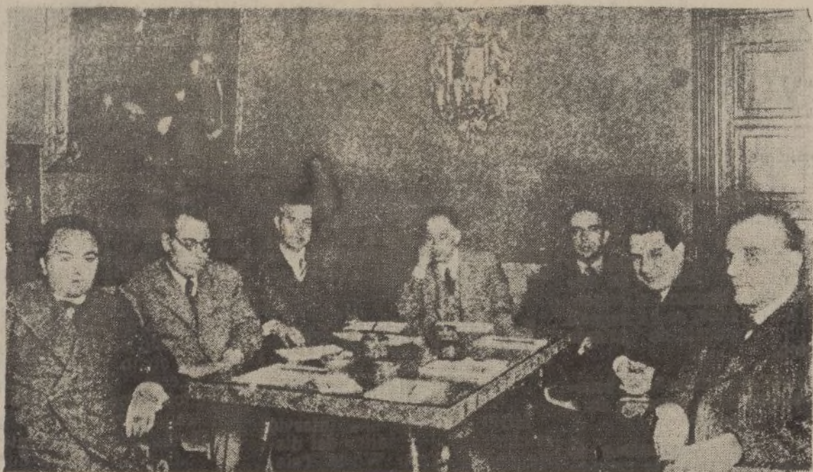
Los consejeros de la Generalidad, bajo la presidencia del señor Companys, reunidos por primera vez después de su toma de posesión.