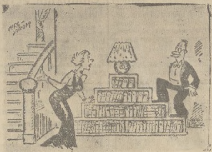
—No, señor mope, la escalera es por aquí (De «Ric et Rac», de París)