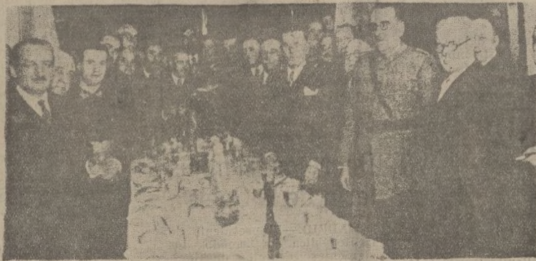
Un momento del agasajo celebrado en el Círculo del Ejército y Armada de Cádiz, como despedida al nuevo subsecretario del Ministerio de la Guerra, general don Julio Mena Zúeco

Contribuirá Vd. a extirpar la mendicidad callejera, si envía sus limosnas directamente a la ASOCIACION ONUBENSE DE CARIDAD