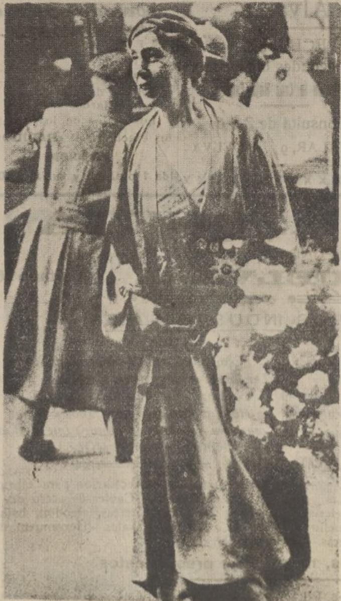
La gran duquesa Cirila de Rusia, prima hermana del zar Nicolás y heredera de los derechos al trono, que ha fallecido en Amorbaeh (Alemania)