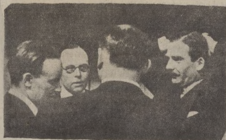
Sir Anthony Eden, ministro de Relaciones Exteriores de Inglaterra, cuya actuación en Ginebra, le hace uno de los personajes del actual momento internacional, conversa con otros delegados en los pasillos del Palacio de la Sociedad de Naciones