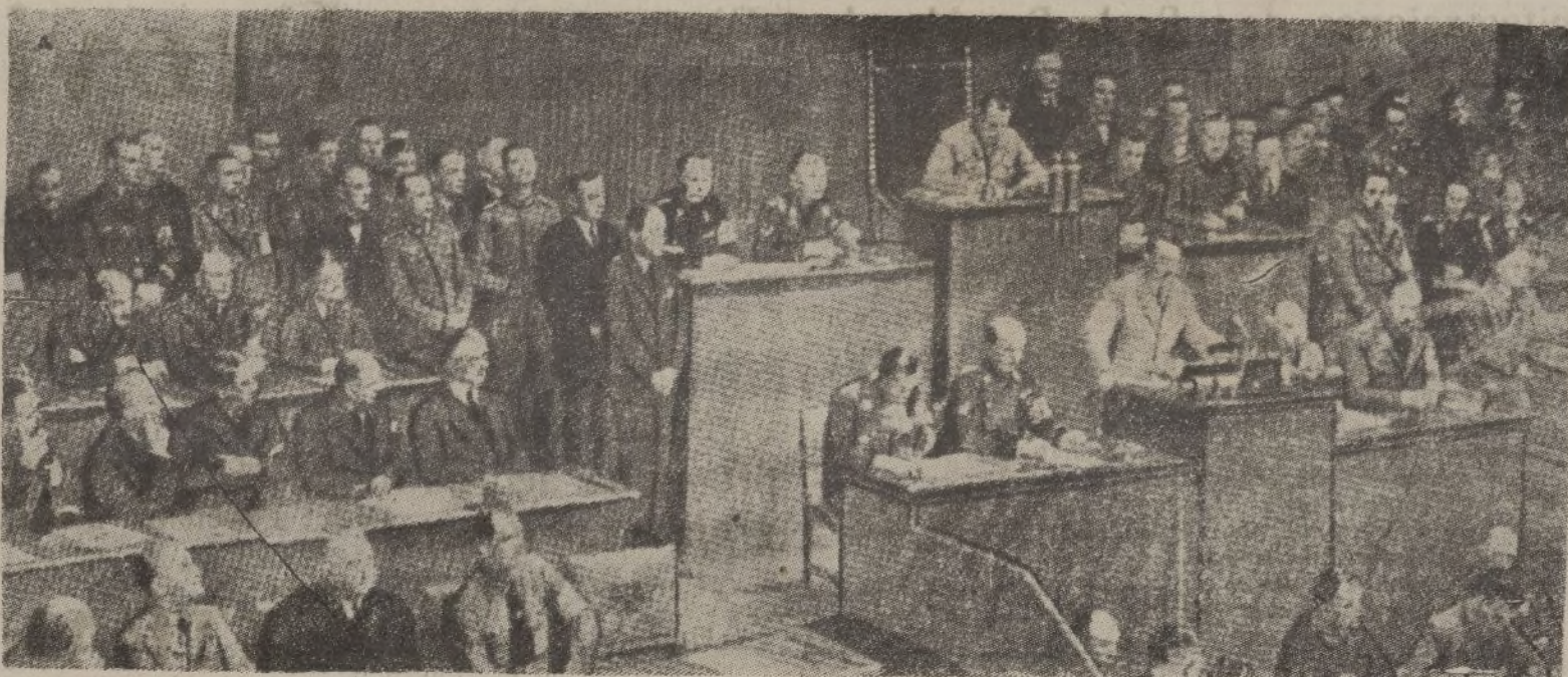
En solemne sesión del Reichstag, el «führer» y canciller Hitler pronuncia el trascendental discurso en que se denuncia el Tratado de Locarno y se notifica la ocupación militar de la zona del Rhin.