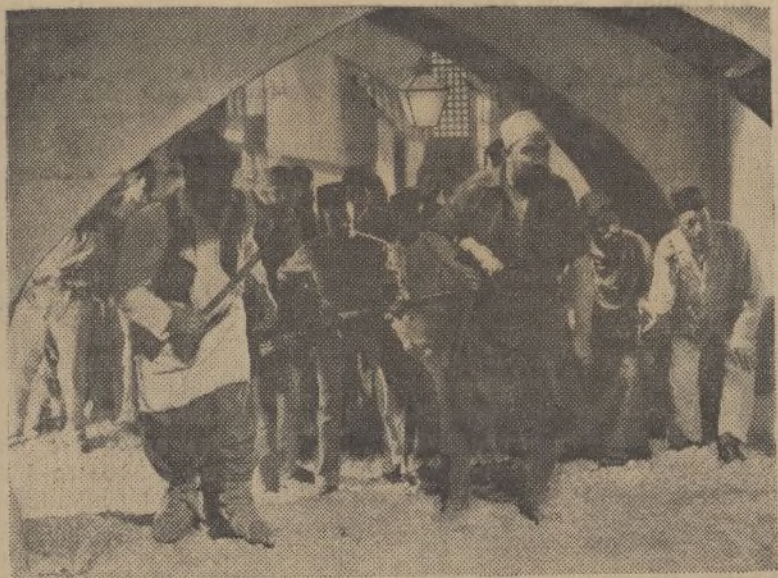
Una interesante escena de la magnífica producción inglesa «ABDUL HAMID» (El sultán maldito), editada por la British International Pictures y distribuida en España por CIFESA