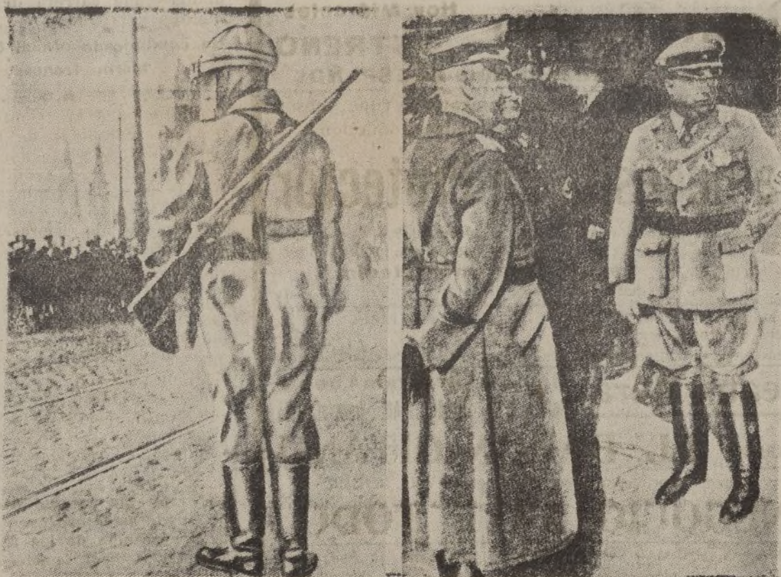
COLONIA.—A la izquierda: El primer soldado alemán que ha de pisar la zona desmilitarizada del Rhin, espera a la entrada del puente de Colonia la orden de atravesar el río.—A la derecha: El doctor Sieben, alcalde de Colonia, da la bienvenida al comandante de las tropas a su entrada en la ciudad.