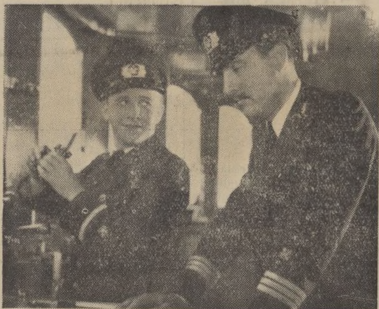
Un plano de la producción inglesa «No me olvides», que distribuye «Cifesa».