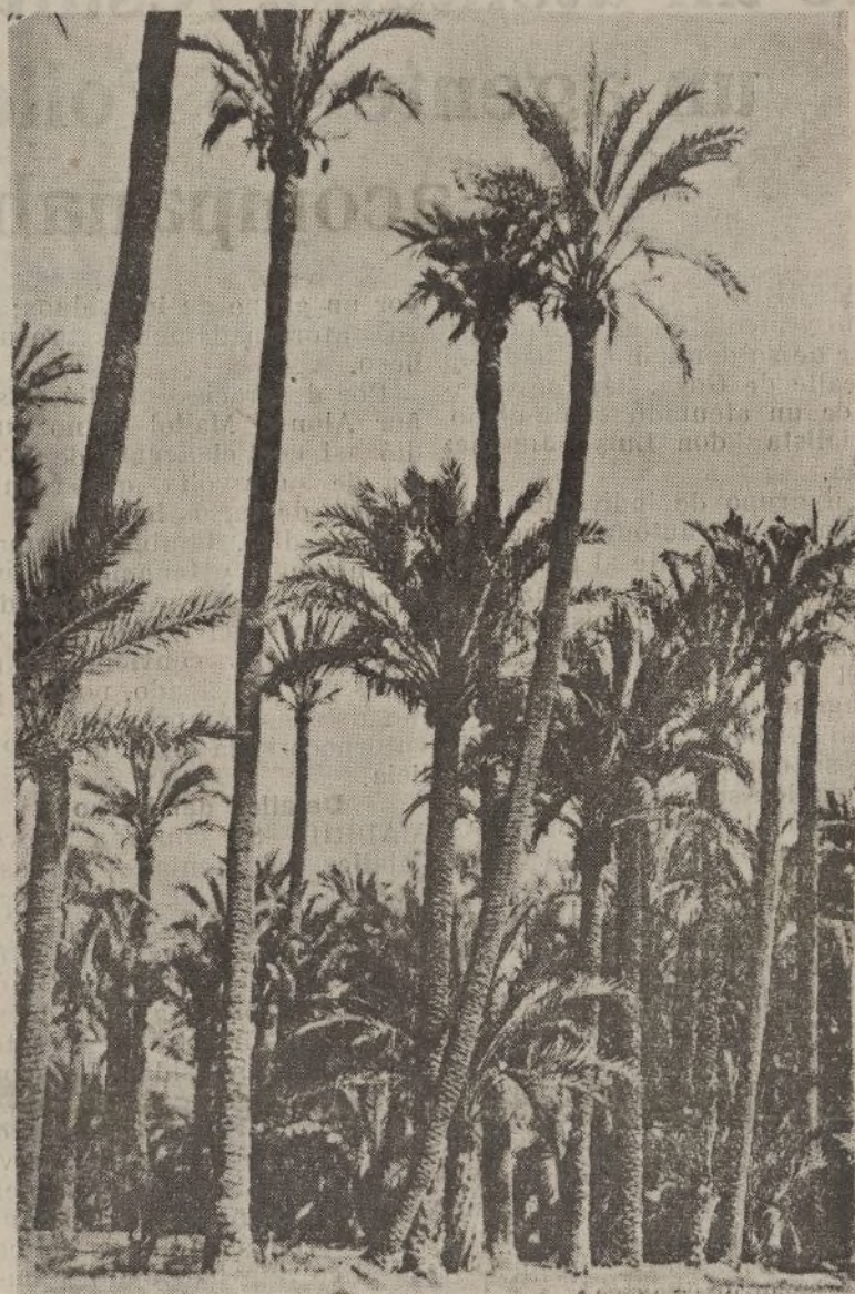
Palmerales de Elche