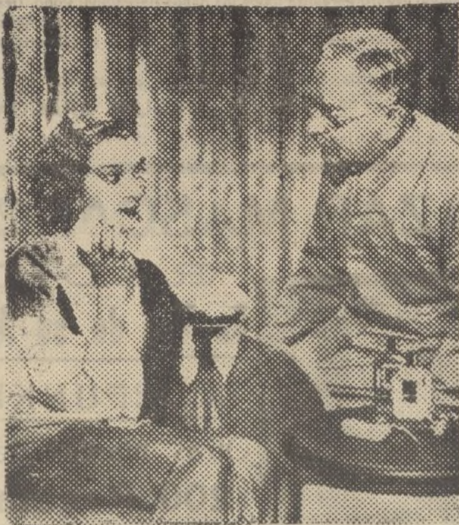
«Aceituna es su color en polvo», aconseja Max Factor a Kathleen Burke, la «mujer-pantera».