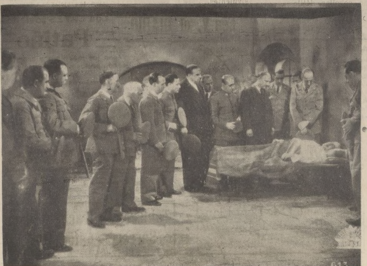
Una escena de la película «idiota» de Maroto, «LA HIJA DEL PENAL», presentada con éxito por la editora valenciana CIFESA

Aquella se combate con el sostenimiento de la ASOCIACIÓN ONUBENSE DE CARIDAD