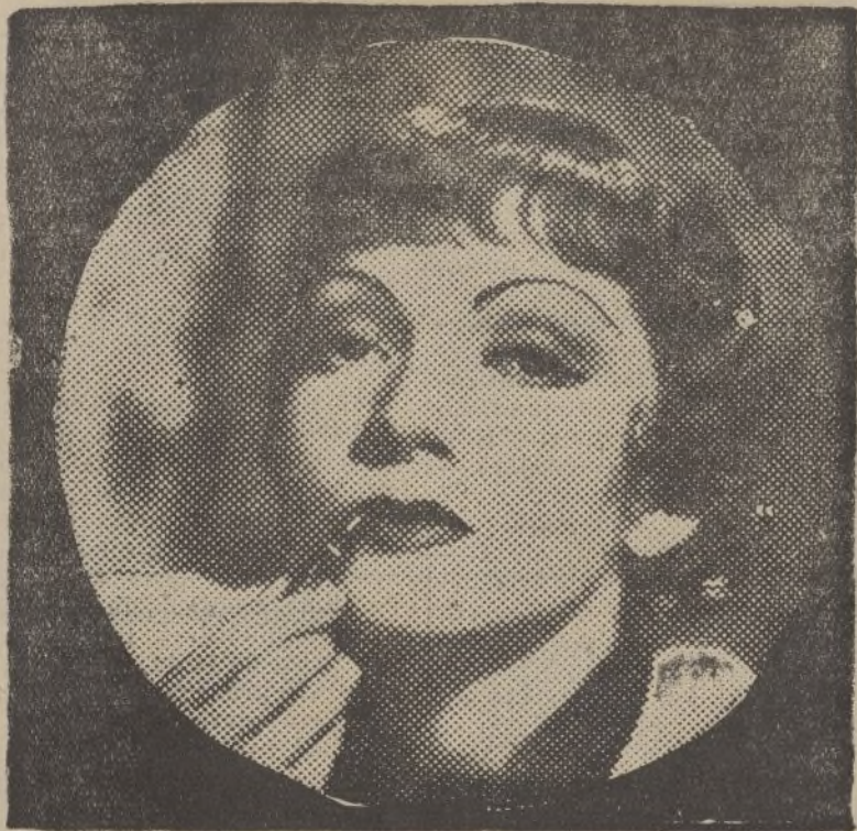
Claudette Colbert, «estrella» de Paramount, escoge creyón de labios Crimson, que guarda perfecta armonía con su tipo y colorido

Sin embargo, muchas veces las uñas que bradizas no acusan debilidad orgánica, sino que tienen su origen en el uso frecuente de jabones muy fuertes o polvos y arenillas de las que se emplean muy especialmente para el aseo de los metales.