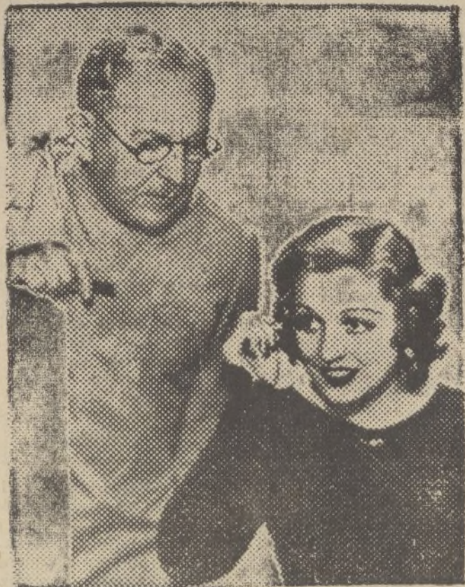
«Con colorete Carmín», le dice Max Factor a Frances Drake, luminaria M-G-M.

Al lado del traje de dos o de tres prendas encontramos la persistente boga del vestido sastre o del vestido abrigo que se sostiene a pesar de lo adelantado de la temporada; el vestido abrigo tiene el parecido absolutamente a un abrigo su-