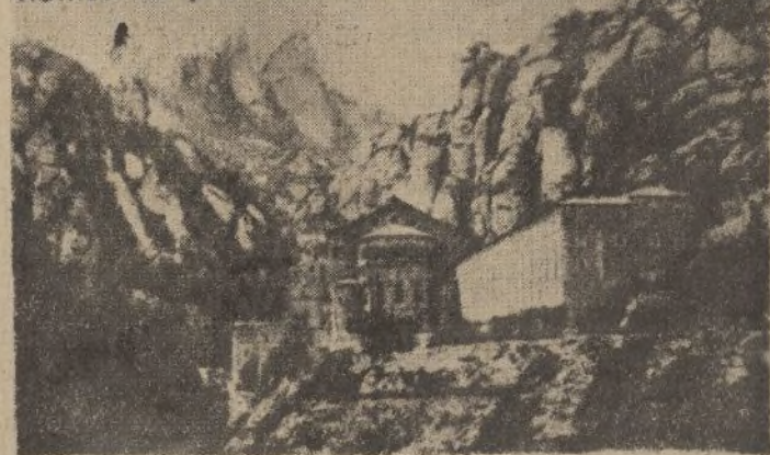
Montserrat (Barcelona). El Monasterio

Así lo observamos nosotros por nuestra parte, congratulándonos muy de veras que se llegue a una inteligencia nuestra en bien de todos.