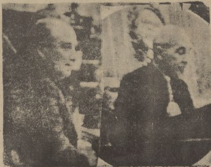
A la izquierda, el señor Largo Caballero, ocupando la presidencia de la Cámara por haber sido su acta la primera que se presentó al Congreso después de los escrutinios. A la derecha, el presidente de la Mesa de edad, señor Carranza, dando lectura al orden del día para la sesión del lunes

En la Papelería del DIARIO DE HUELVA encontraréis el surtido más completo de material para dibujo, a precios no conocidos; plumas estilográficas, funcionamiento garantizado, desde 1.50 ptas.; cajas de pinturas, desde 0.50, cajas de lápices de colores, etc.,