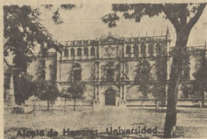
Ateneo de Huelva - Universidad