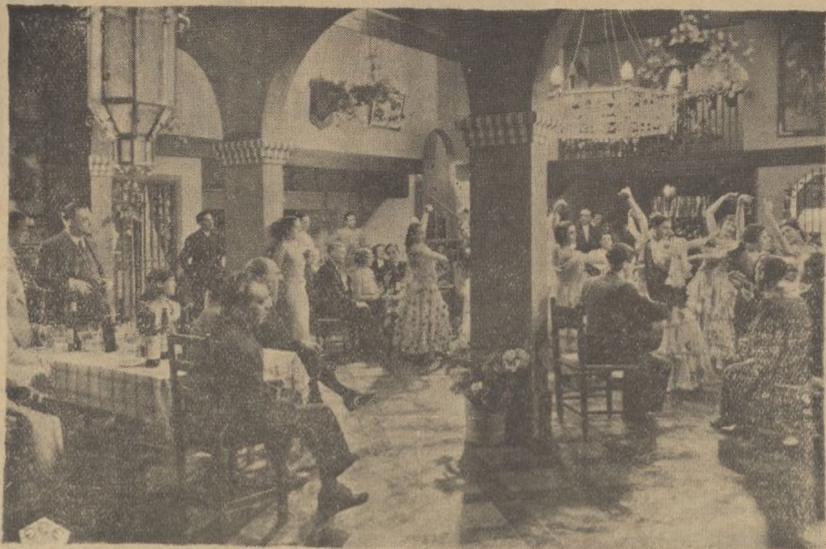
Un sugestivo plano de la producción nacional «Currito de la Cruz», que ha realizado Fernando Delgado para E. C. E.

Vera y Gary, impresionan actualmente en los estudios lon-