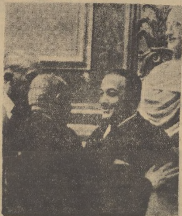
Después de la votación celebrada en la Cámara de los diputados para elegir presidente de las Cortes, el señor Martínez Barrio, que resultó elegido, es muy felicitado en los pasillos de las Cortes

Rectificando el anuncio de distribución de contingente de cueros (partidas 176, 177 y 178) publicado en la «Gaceta» del 4 del actual