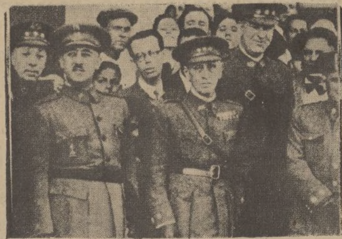
El nuevo comandante militar de Canarias, general don Francisco Bahamonde, a su llegada a Santa Cruz de Tenerife, para tomar posesión de su cargo.

«Como en la reciente ley de Amnistía no están muy claros los casos de aplicación de sus beneficios a los presos comunes, cuyos delitos se hallan enlazados con otros de índole política, he conferenciado con el ministro de Justicia, pidiéndole que en cada caso se resolviera con estricta justicia, porque una disposición de carácter general equivaldría a que la amnistía alcanzase a presos que no están en las cárceles por delitos políticos, sino por delitos comunes claramente penados en el Código Hay que establecer, pues, la diferencia justa entre unos y otros casos, y eso tiene precisamente el acuerdo adoptado por la minoría socialista.»