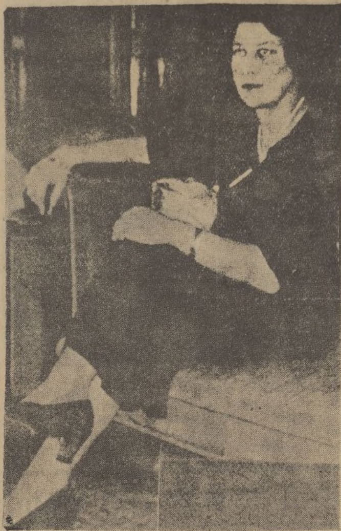
La princesa Eugenia de Grecia, que cuenta veinticinco años y reside en París, a quien los periódicos ingleses señalan como la princesa que tiene más probabilidades de ser futura reina de Inglaterra.