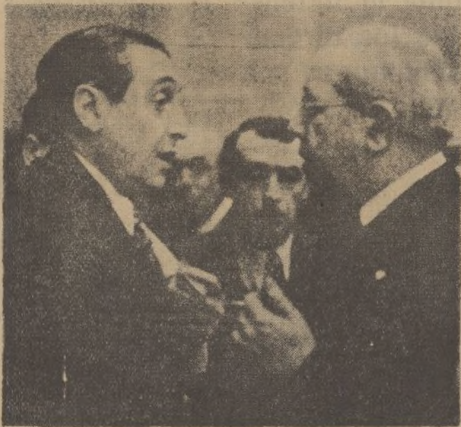
En la Cámara de los Diputados las conversaciones y diálogos se prodigaron en la primera tarde de la reunión parlamentaria. El presidente del Consejo, señor Azaña, y el diputado socialista, señor Jiménez de Asúa conversan en el pasillo del Congreso.