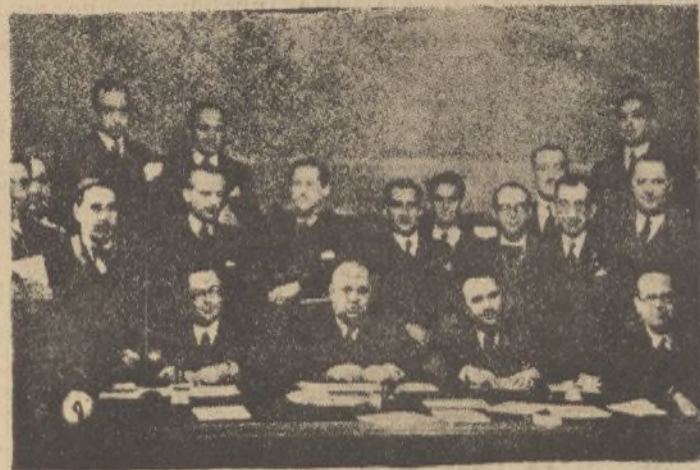
En el Congreso se reunió la Comisión parlamentaria de Actas y Calidades, que designó presidente al exministro socialista don Indalecio Prieto