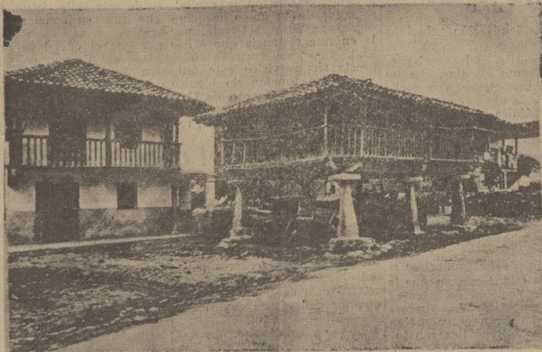
Cangas de Onís.—Un hórreo