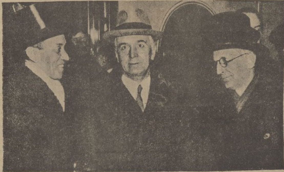
Nuestro ministro de Estado, señor Barcia, a su llegada a Londres, para asistir a las reuniones del Consejo de la Sociedad de Naciones, en unión del señor Mudariaga, delegado de España en el organismo ginebrino y del embajador español en Londres, Sr. Pérez de Ayala

Y en otro editorial escribe: «Nuestro servicio de inteligencia nos proporciona elementos de juicio alarmantes. Ciertamente, el Gobierno hace lo que debe, dando notas de que «no pasa nada». Pero ni la previa censura ni la discreción oficial impiden que circulen por los cuarteles y por las calles y centros políticos hojas cuyo contenido amenazante y conminatorio sería peligroso desconocer.