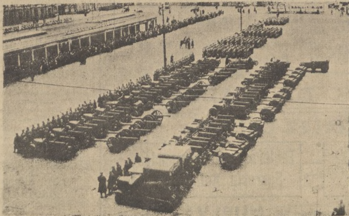
En Strasburgo, las tropas francesas están realizando maniobras. El general Gomelin, a su llegada a aquella ciudad, pasa revista a las fuerzas de Artillería.