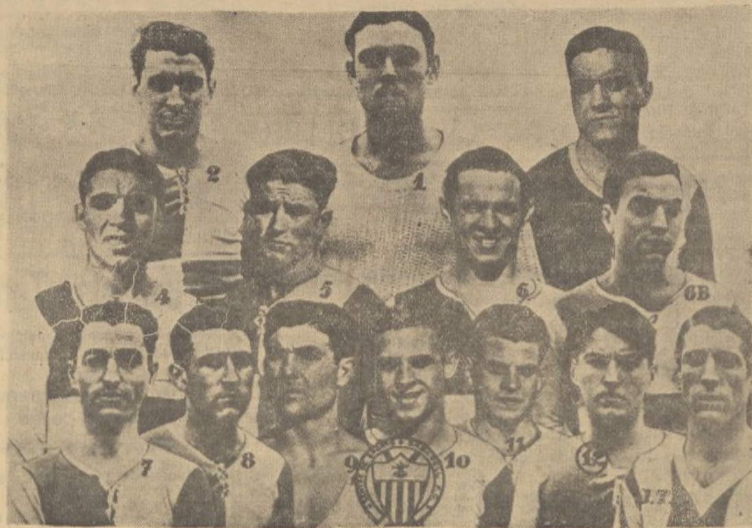
Equipo del Sabadell, que en partido para las eliminatorias del campeonato de España, se enfrentará mañana domingo con el Júpiter