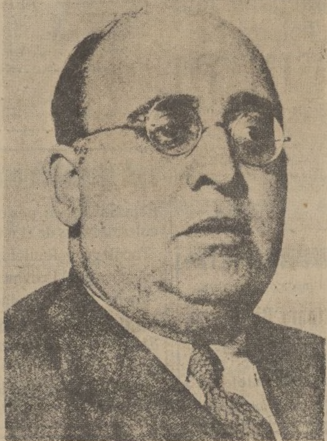
Don José María Cossío, a quien la Academia Española ha otorgado el premio «Fästenrath» por su obra «Los toros en la poesía»