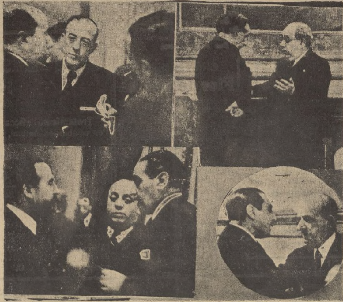
1.º, el señor Gil Robles, al salir del despacho del presidente de la Cámara, comunica a los periodistas el aplazamiento del debate sobre el orden público -2.º, el aplazamiento del debate político, por indisposición del ministro de la Gobernación, restó interés a la jornada parlamentaria. Fueron en cambio, numerosas las conferencias celebradas en los pasillos. Ved al señor Azaña en animada charla con don Julian Besteiro.-3.º, don Miguel Maura, sostiene una conversación con los ex ministros don Indalecio Prieto y don Fernando de los Ríos.-4.º, el conde de Romanones, que, atraído por el debate político, acudió al Congreso, conversa animadamente con el diputado socialista don Luís Jiménez Asúa

CUARENTA MIL 029 039 048 073 084 104 127 136 143 149 163 174 188 209 241 274 283 293 304 309 310 316 362 363 374 390 405 407 408 421 436 438 439 440 454 463 494 502 530 541 548 551 583 605 624 631 645 664 668 737 808 833 842 847 865 877 882 883 939 961 983 984