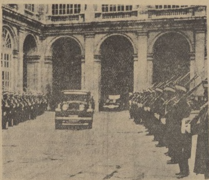
Los diputados que constituyen la Mesa interina del Congreso acudieron a cumplimentar a Su Excelencia el Presidente de la República. Las tropas les rindieron honores al salir del Palacio Nacional. Con el señor Martínez Barrio formaron la Comisión los ex ministros señores Casanueva y Sánchez Albornoz, el señor Rosado Gil y don Dinás Madariaga.