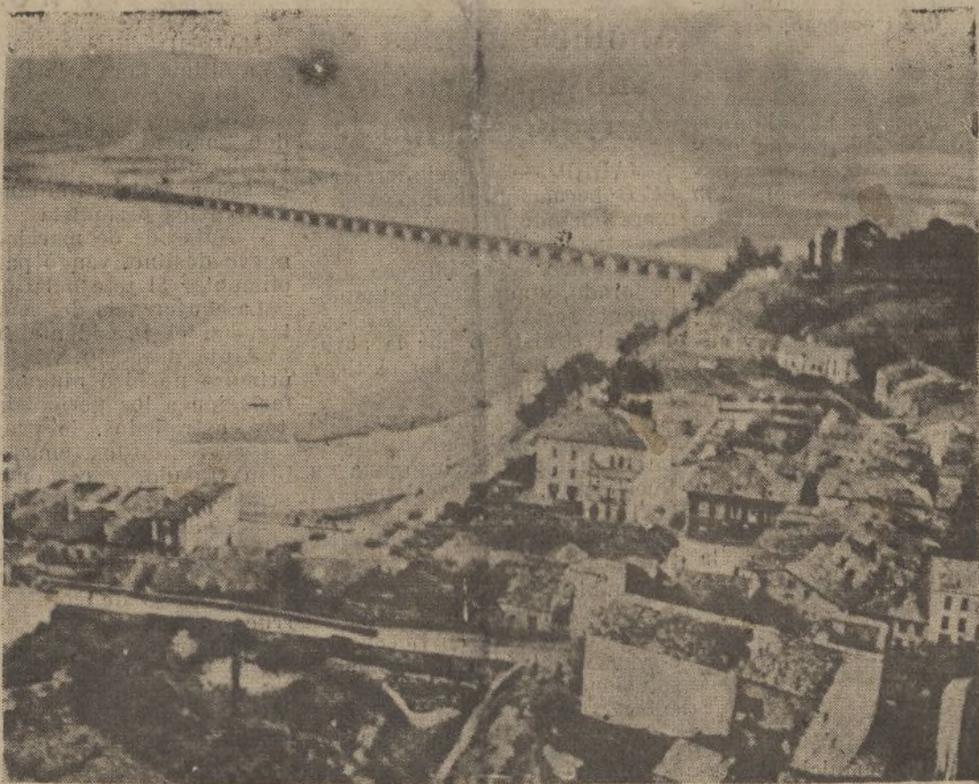
SAN VICENTE DE LA BARQUERA. VISTA PARCIAL