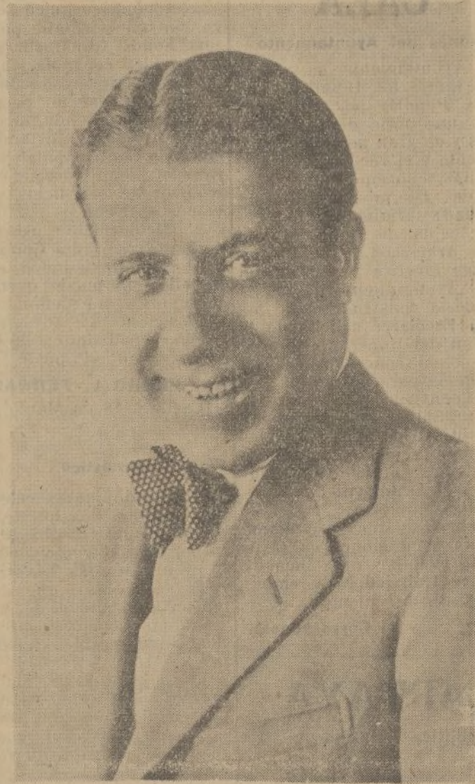
Miguel Liger, el popularísimo actor de la pantalla española, que con sus graciosas charlas deleitará a los aficionados onubenses en fecha próxima, actuando personalmente en un teatro de la capital