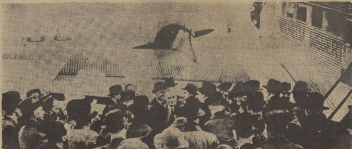
La Delegación alemana llegada a Londres, invitada por las potencias signatarias del Tratado Locarno, en el momento de salir del avión, en el aeródromo de Croydon

De ser verdad tal noticia, sería aconsejable que el japonés siguiera guardando su secreto