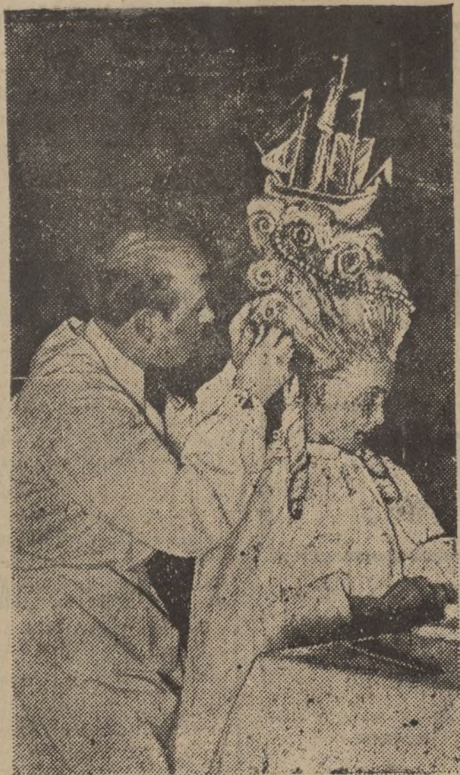
En Berlín se ha celebrado un concurso de peinados, al que asistieron infinidad de artistas peluqueros. La foto representa uno de los modelos presentados en este concurso, denominado «Fragata»