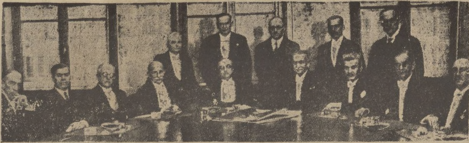
EL NUEVO GOBIERNO DE GRECIA