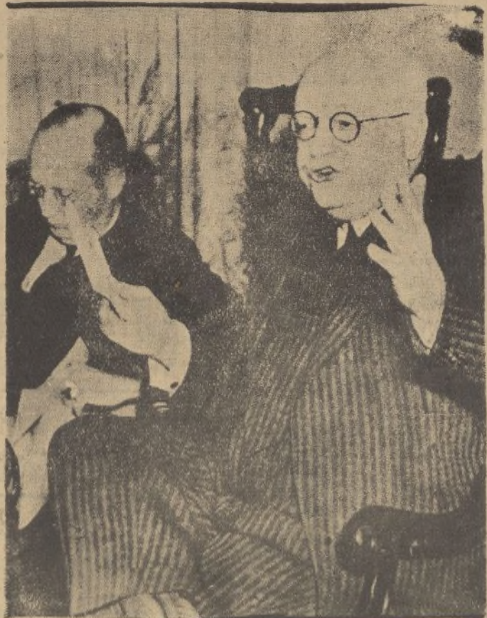
El doctor Hans Luther, embajador de Alemania en los Estados Unidos, que firmó el Tratado Locarno en nombre de Alemania, explica a un periodista por qué Alemania ha vuelto a ocupar militarmente Renania.