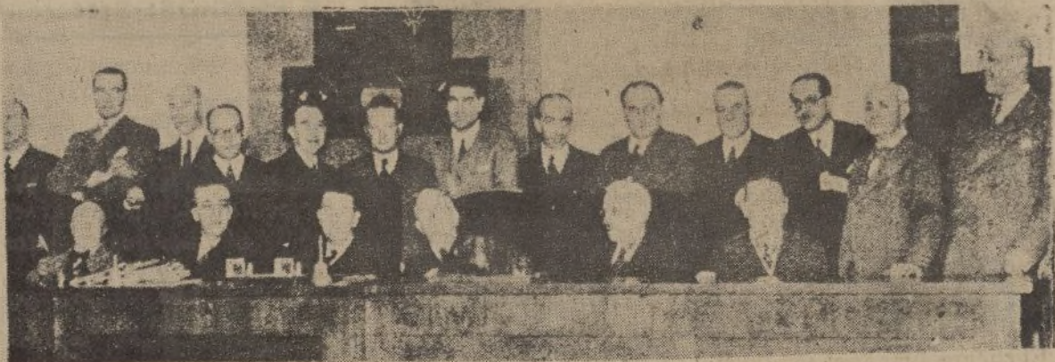
En Madrid ha celebrado su segunda reunión la Junta de gobierno del Congreso Nacional de Obras Públicas.

«El Parlamento es la expresión de la soberanía popular. Pero esta soberanía no existe,