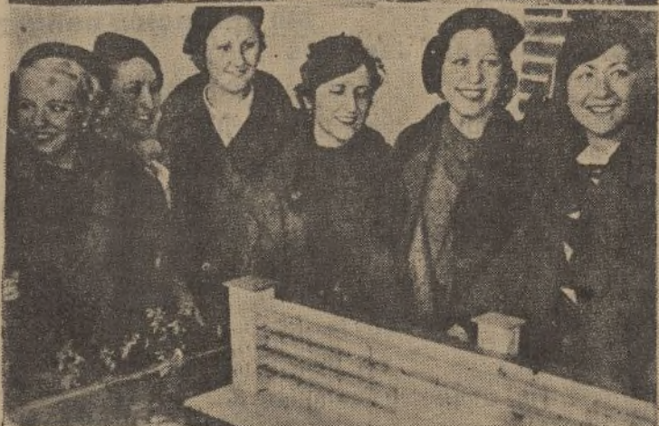
En Valdelatas tuvo lugar el domingo último la colocación de la primera piedra para el Sanatorio Antituberculoso de Funcionarios Públicos.—Abajo, bellas señoras concurrentes a la colocación de la primera piedra de dicho Sanatorio, ante la maqueta del futuro edificio