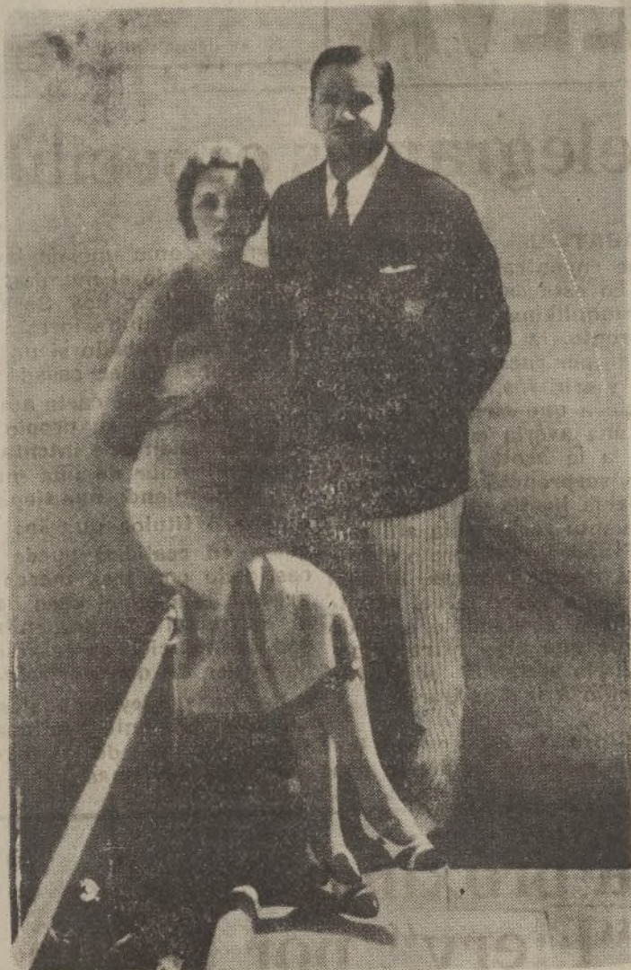
El artista cinematográfico Wallace Beery en compañía de su señora, en el jardín de su domicilio, en Beverly Hills.