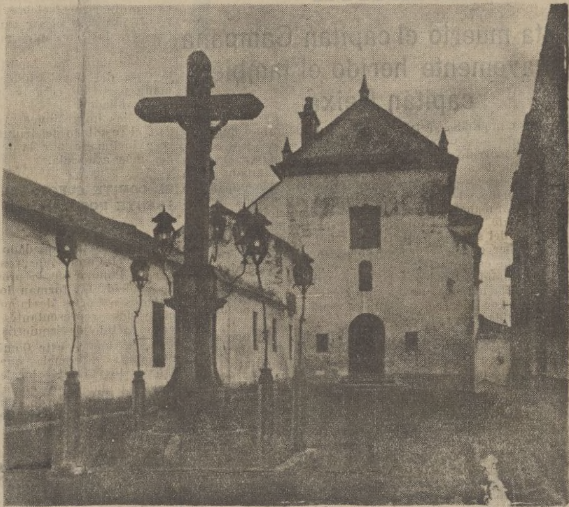
EL CRISTO DE LOS FAROLES