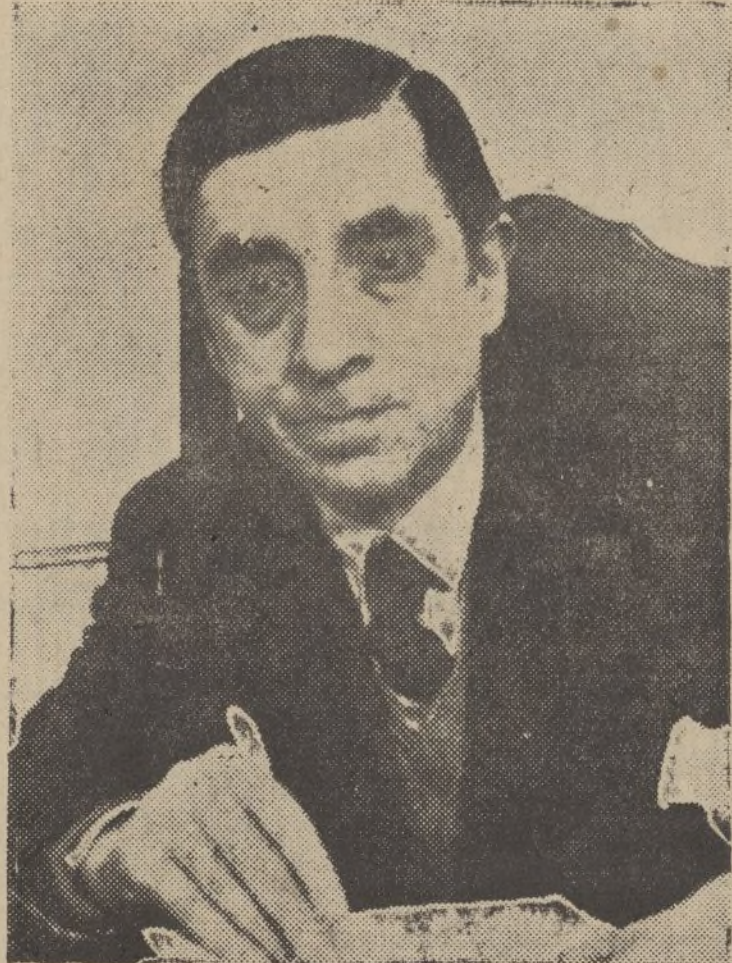
El ilustre poeta, Francisco Villaespesa, cuyo estado de salud inspira algún cuidado

No lo olvide, Atocha, 94 2.º Ctro., MADRID Teléf. 76541