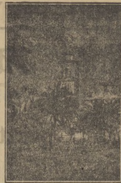
Vista de la Plaza de la Libertad

Finalmente, el Ayuntamiento de La Palma, en la relación de obras que se ha ofrecido al Estado con miras a la inversión de los millones para remediar el paro forzoso, ha pedido la inclusión de un edificio para Correos y Telégrafos y de