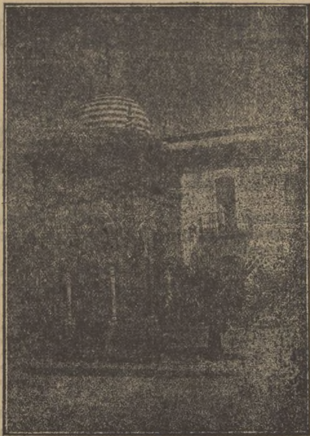
La artística fuente de Nuestra Sra. del Rocío

Por lo que toca a salubridad y buen clima es detalle muy significativo que, durante dos años consecutivos, la Dirección General de Sanidad haya felicitado a los médicos de La Palma, por ser este el pueblo de toda España, donde menos mortalidad infantil se ha registrado.