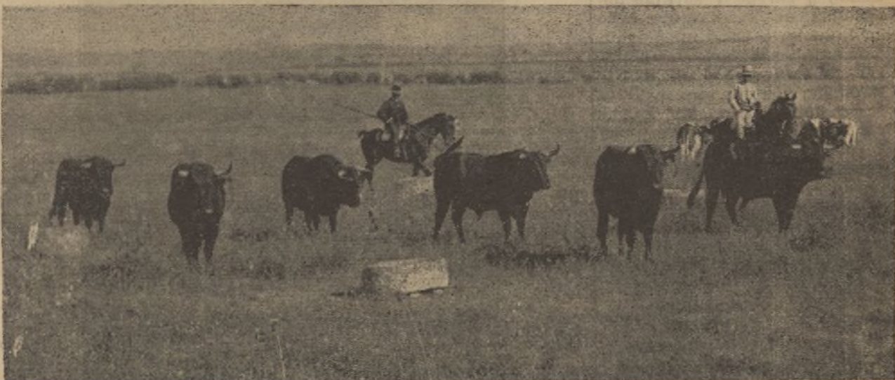
VAYAN TOROS. Así son los de VERAGUA (hoy Domecq)

das abribeñas?... Nadie lo sabe, hasta ahora. Ni siquiera los iniciados en todos los secretos. El cartel es un secreto, de verdad, que nadie pudo descifrar. Por Sevilla pasaron estos días últimos algunos toreros que reanuncian de los cosos americanos. Unos, con ilusiones y gloria; otros, con la pesadumbre de una temporada frustrada. Domingo Ortega—uno de los que cruzaron raudamente, sin detenerse en Sevilla apenas unas horas—era esperado con interés. Hay quien dice que Pagés había venido expresamente a Sevilla para catequizar al torero de Borox que no anda muy en trato cordial con el in-