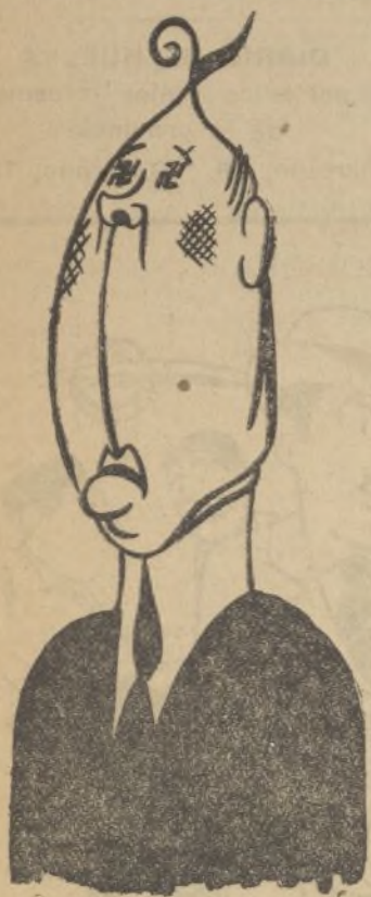
El jefe de la Ceda, señor Gil Robles, cuya ausencia del Gobierno será causa de la próxima catástrofe parlamentaria.