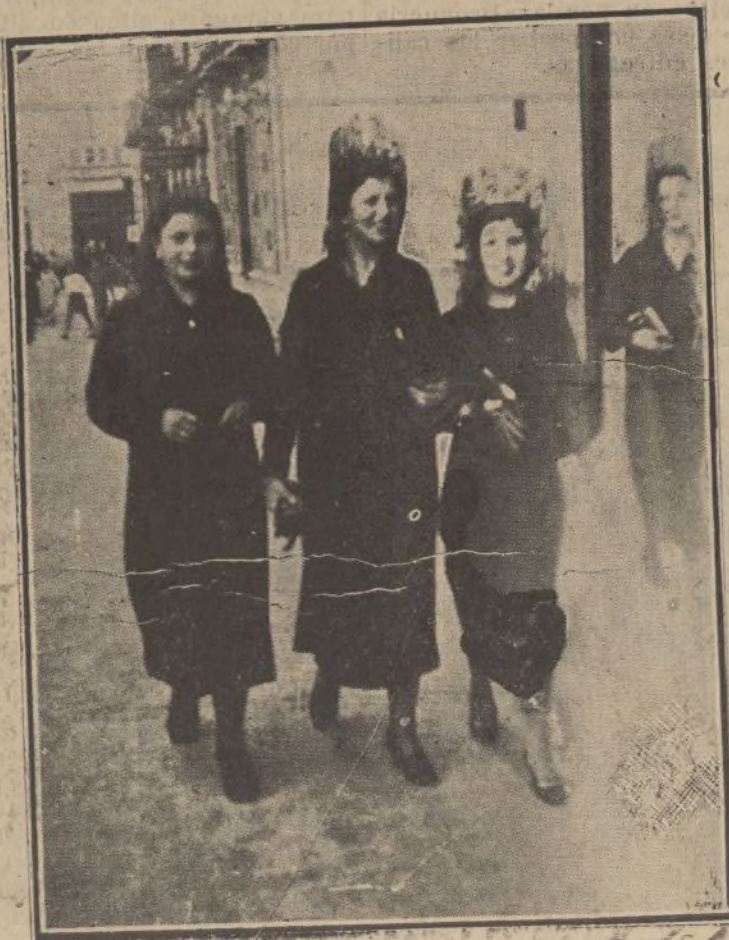
Sonrisas del Jueves Santo en labios de mujeres preciosas. He aquí un motivo de formidable atracción para la Semana Santa onubense.