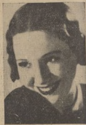
«STARS» DE LA PANTALLA

El famoso actor de la productora Columbia Pictures, que hace una verdadera creación en este interesante «film».