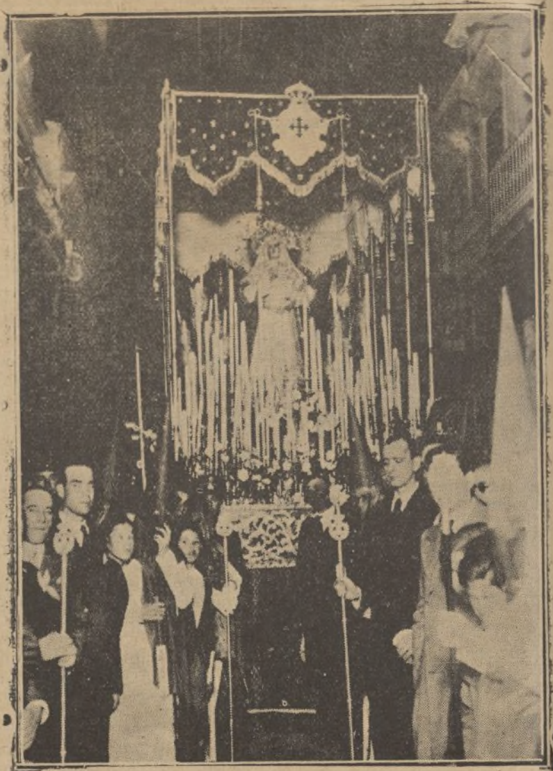
El hermosísimo "paso" de María Santísima del Mayor Dolor, que con extraordinaria brillantez hizo estación en la noche del Miércoles Santo.

A Ayamonte se le socorrió porque en las venas del pueblo quedó una gota de sangre rebelde que sirvió para encender en los pechos de sus hijos la llama santa de la fraternidad, del amor a sus semejantes. Y Ayamonte, rendida como Niebla, supo enderezarse y pedir, exigir a los poderes por medio de la prensa y de la palabra, lo que todos debemos de pedir: trabajo, para no dejar morir de hambre a un pueblo.