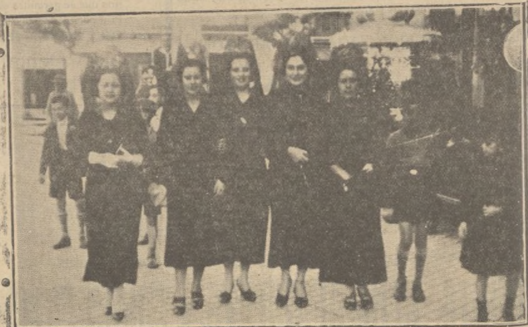
Cinco bellísimas señoritas con la clásica mantilla y la airosa peineta. Hay belleza, hermosura y simpatías por toneladas. ¡Si son de Huelva!

En la parroquia del Corazón de Jesús, los oficios serán a las ocho de la mañana.