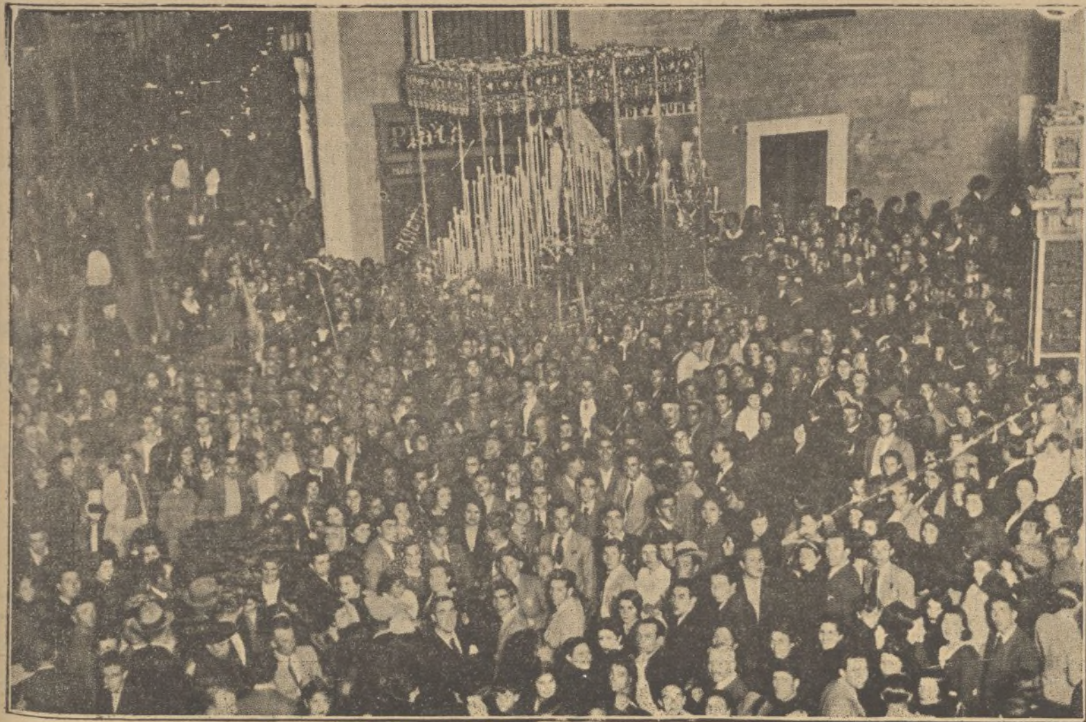
Como broche de oro cierra nuestra Semana Santa la Cofradía de Vera Cruz.