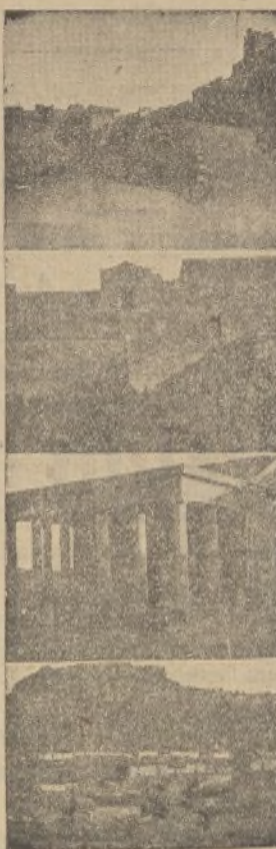
RUTAS DEL TURISMO