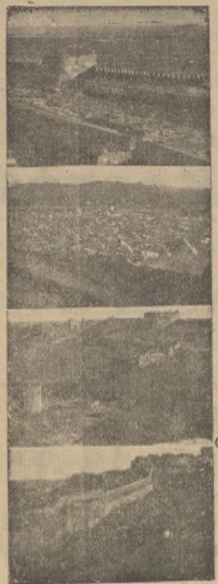
Película de Sagunto