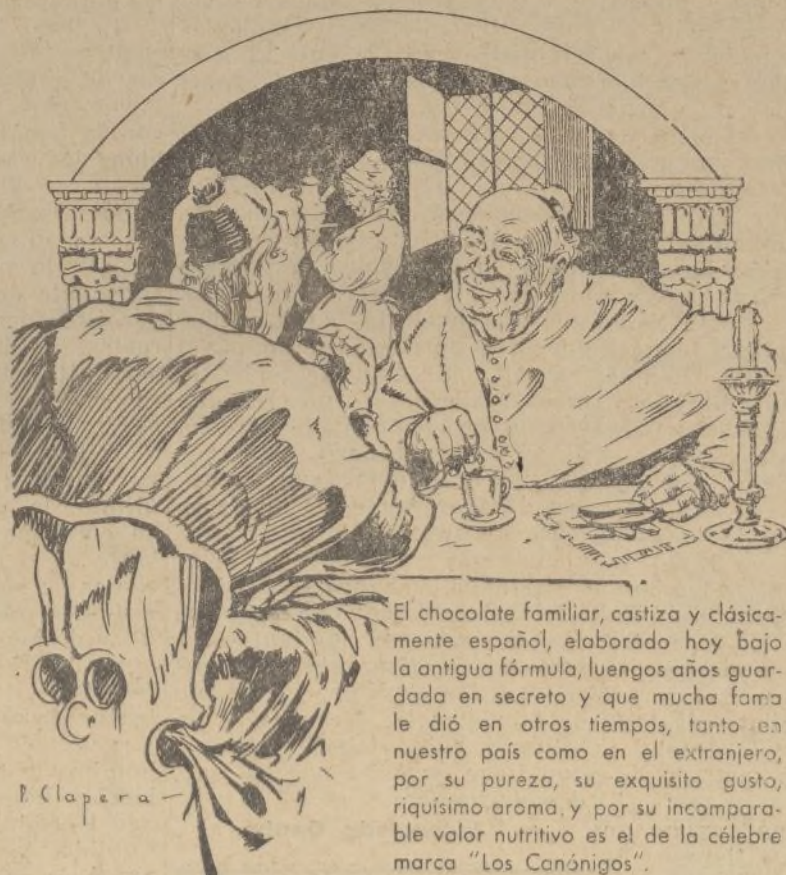
«Una jicara de chocolate "Los Canónigos" es otra de las delicias de España».

MADRID.—Mañana en el rápido llegarán a Sevilla Miss Madrid 1935, Miss Zaragoza y Miss Valencia, que van invitadas para ocupar el palco de honor en la corrida del domingo día 12.