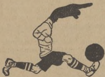
Una nota patriótica

España ha dado un curso de buen futbol, jugando el mejor partido desde que es seleccionador el señor Salazar.-Lángara fué el autor de los dos goles españoles.-Una gran tarde de Eizaguirre.