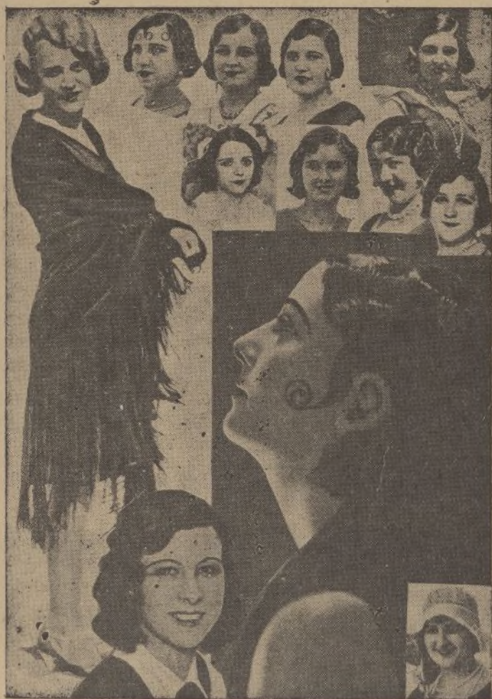
Modistillas madrileñas, gracia y alegría de estas verdaderas fiestas populares que son las verbenas del Madrid castizo, jaranero e inmortal