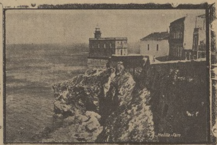
Esto es eso: poesía salvaje, mora, engarzada en los puñales del Mediterráneo...

ledades, el montón de ruina de algo que fué grande, la majestad soñadora e hidálgica de cosas que la abandonaron a su destino. Pero sentirme junto, con, a las orillas espumosas, pinchadas por riscos de ésta costa rifeña, sangrienta de hechos y gloriosa de espanto. Yo, quisiera ser soñador, sí; pero oc una Melilla sin entrañas líricas, románticas, sin aromas de cuentos de miedo. Pero sí, soy soñador: sueño, no con la Melilla resucitada, sino con los pedazos de calles y muros contrahchos de romances).