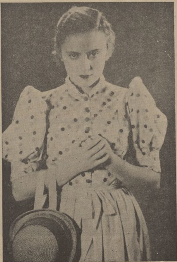
REGINA , la candorosa muchacha del pueblo que en aras de un ferviente amor logró ocupar un puesto en la más encumbrada sociedad, siendo víctima de perfidias e intrigas que mancharon su candor y destrozaron su hogar. Un «film» presentado por Cifesa