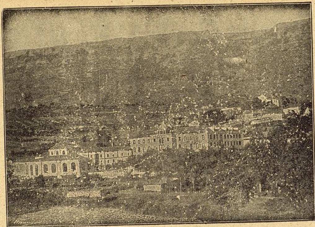
Vista del Balneario de Zuazo (Álava).

El crédito universal que ha alcanzado este importante Establecimiento, es la mejor garantía de las virtudes curativas de estas especiales aguas minerales en todas las enfermedades crónicas del órgano respiratorio , sean ó no diatésicas y cualquiera el lugar de este aparato en que se hallen localizadas. La feliz asociación mineral del sulfuro de sodio al nitrógeno que poseen, llena la doble indicación que el médico se propone en la mayor parte de los enfermos de pecho y garganta que con tanta frecuencia lo necesitan; demostrado palmariamente con los satisfactorios resultados obtenidos en enfermos, y que no consiguieron con ninguna agua mineral dotada tan sólo de uno de estos dos principalísimos factores. La Sociedad propietaria, deseosa de corresponder á la numerosa y selecta concurrencia que acude en busca de su salud, no ha perdonado medio para proporcionarles cuanto aconseja la ciencia médica moderna, montando al efecto un Balneario de nueva planta, dotado de cuanto más útil se conoce en el extranjero para conseguir los mejores resultados. Un millón de pesetas gastado en las nuevas obras demuestran la importancia de las mismas, comprendidas en ellas un suntuoso hotel con fonda de primer orden á la española y francesa para todas las clases de la sociedad; elegantísimo salón de fiestas; café y billares; preciosa Capilla pública; galerías cubiertas para paseo y un gran parque para recreo, iluminándose todos los edificios con profusión de luz eléctrica.