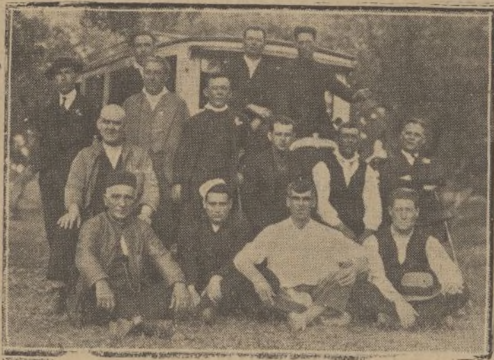
«LOS 15» en una de sus excursiones campestres

Un ferroviario de Zafra a Huelva Huelva, Mayo 1935.