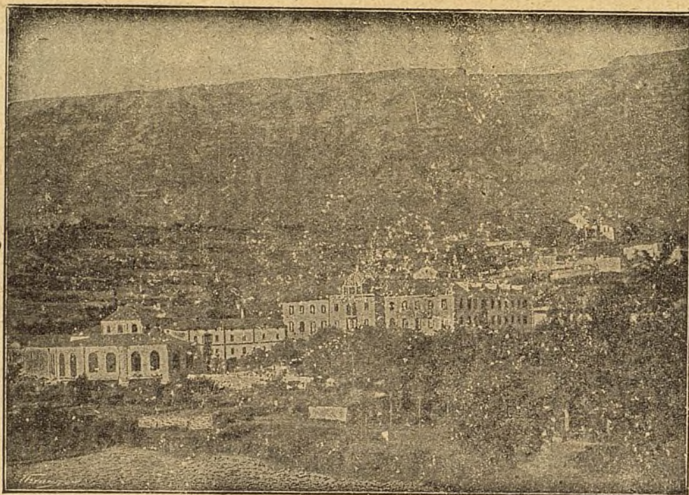
Vista del Balneario de Zuazo (Alava).