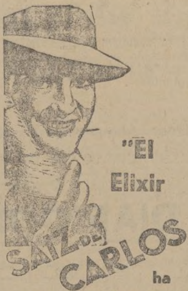
El Elixir CARLOS ha curado mi estómago...

Esto no sentó bien al industrial, celoso de sus intereses, quien salió en pos del «cliente», dando cuenta del caso pa-