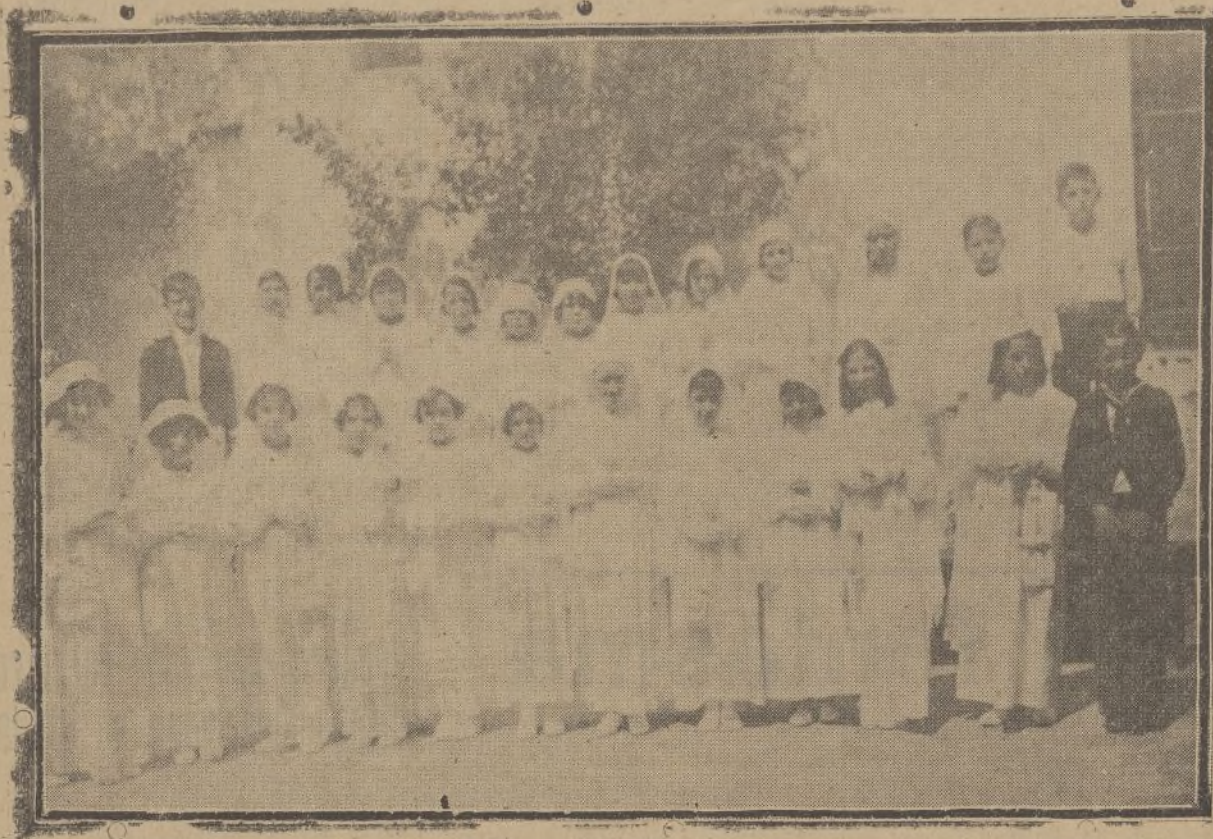
Alumnas del Colegio del Santo Angel que recibieron esta mañana, por vez primera, la Sagrada Comunión.

Esta mañana en el Colegio de Santo Angel se ha celebrado una fiesta muy simpática.