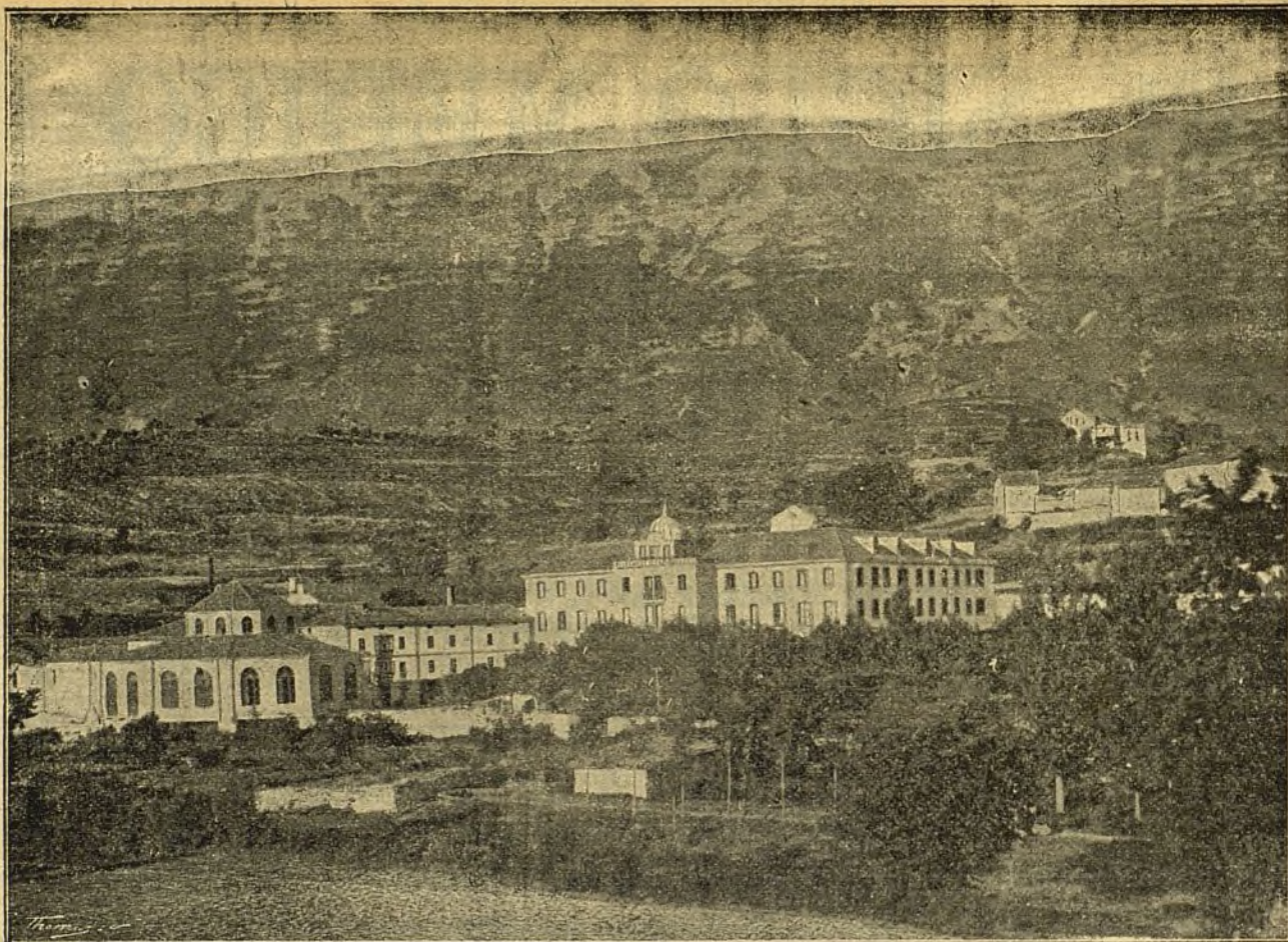
Vista del Balneario de Zuazo (Álava).