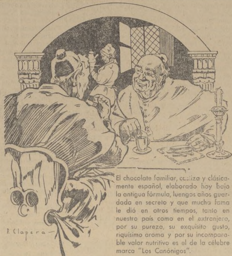
«Una jicara de chocolate «Los Canónigos» es otra de las delicias de España».

La Policía, en posesión de los domicilios donde los dos de tenidos aseguraban poseer la tirada completa del libro, preparado en contra de la Sociedad Editorial, practicó un registro, incautándose de cuatro mil ejemplares, gran cantidad de prospectos y otros documentos dispuestos para dicha campaña.