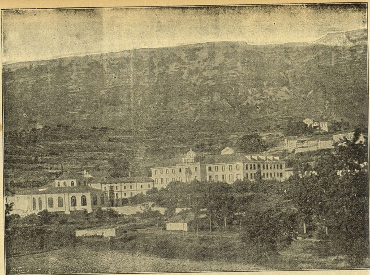
Vista del Balneario de Zuazo (Álava).