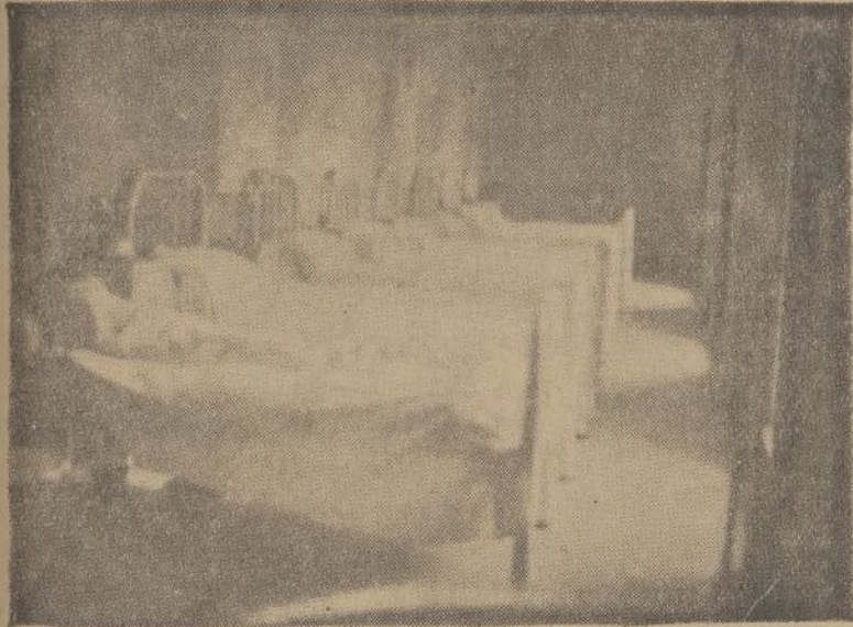
Sala de cirugía número 10, destinada a mujeres.

Está a cargo del jefe clínico, por oposición del Hospital don Félix Sanz de Frutos