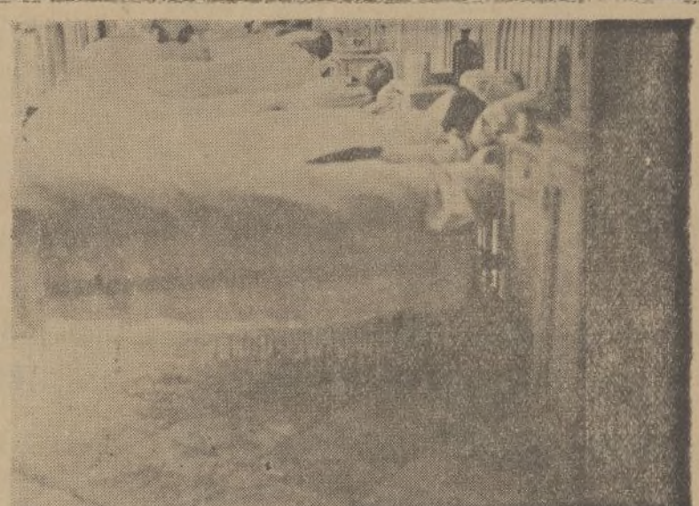
Sala de pago, de reciente construcción, para mujeres.