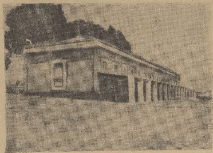
Vista de la Enfermería para tuberculosos, enclavada en el lugar conocido por la Morana.

Seguramente, si el gobernador, señor Fernaud, que tanto se atana por todos los asuntos que tienden al mejoramiento de esta provincia, se decidiera a visitar dicha Enfermería, —que no conoce, según nuestras referencias— su influencia, valiosa y decisiva ante los Altos Poderes, conseguiría que el repetido centro sanitario, olvidados todos los trámites burocráticos que tanto entorpecen, quedaría en condiciones de un inmediato funcionamiento, que tardaría el tiempo que se in-